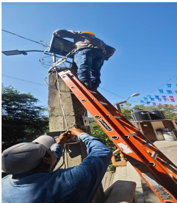
INSTALACION DE REFLECTORES EN BARRIO DE SAN RAFAEL POR FIESTAS PATRONALES