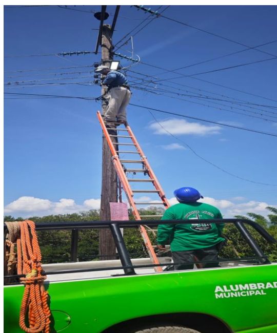
ARREGLO DE UNA LUMINARIA EN XICOTLA