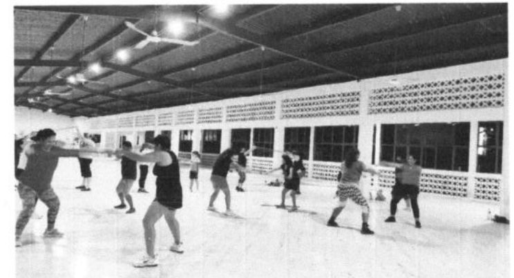
Imagen respectiva a un día de clase en la Disciplina de Zumba