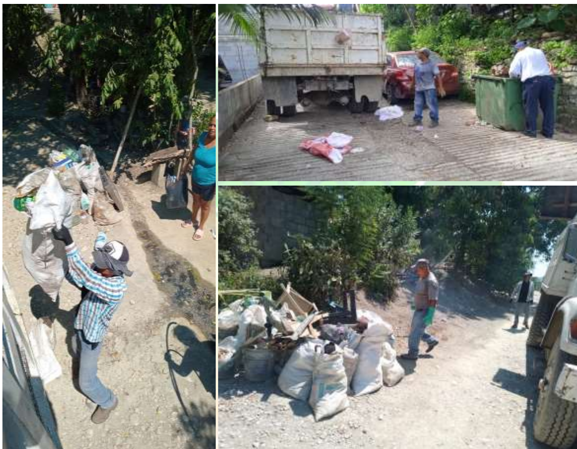
(Ilustraciones.- descacharrización en el municipio y sus comunidades de Tancahuitz)