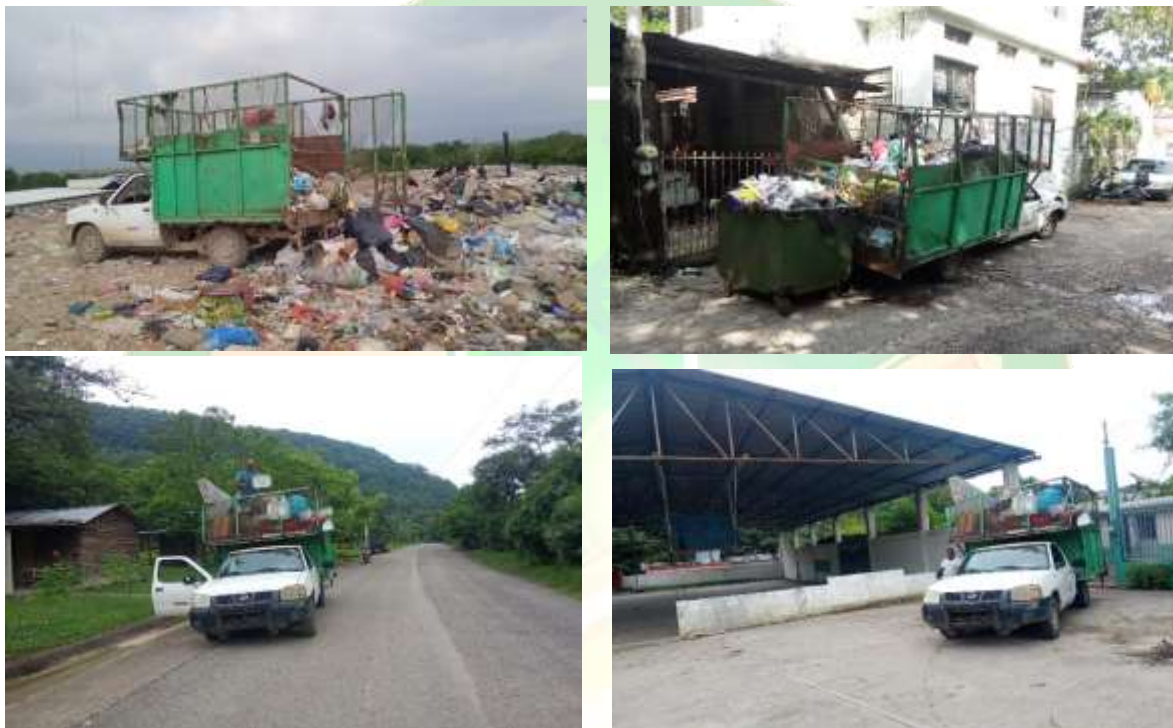
(Ilustraciones.- Recolección de basura en los municipios de Tancahuitz)