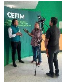
En Cefim “Feria Verde

Atendiendo la convocatoria de la Contraloría General del Estado, la Cefim participo en la Primera Reunión Informativa de los Comités Institucionales de Gobierno Abierto CIGA´s.