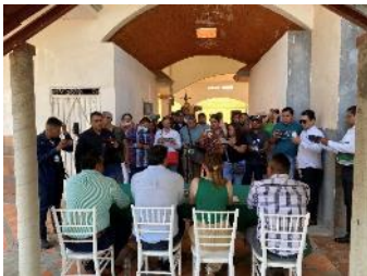
En Tamazunchale “Jornadas de Capacitación Cefim-Contraloría”.