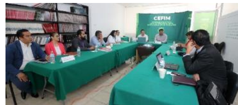
Reunión de Trabajo con Enlaces de las Universidades UASLP, UICSLP, UNID, UP, y Matehuala , para seguimiento al programa de Certificación de Funcionarios Públicos Municipales.