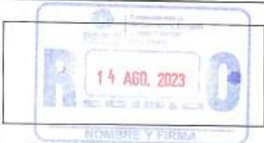
SELLO DE LA DEPENDENCIA