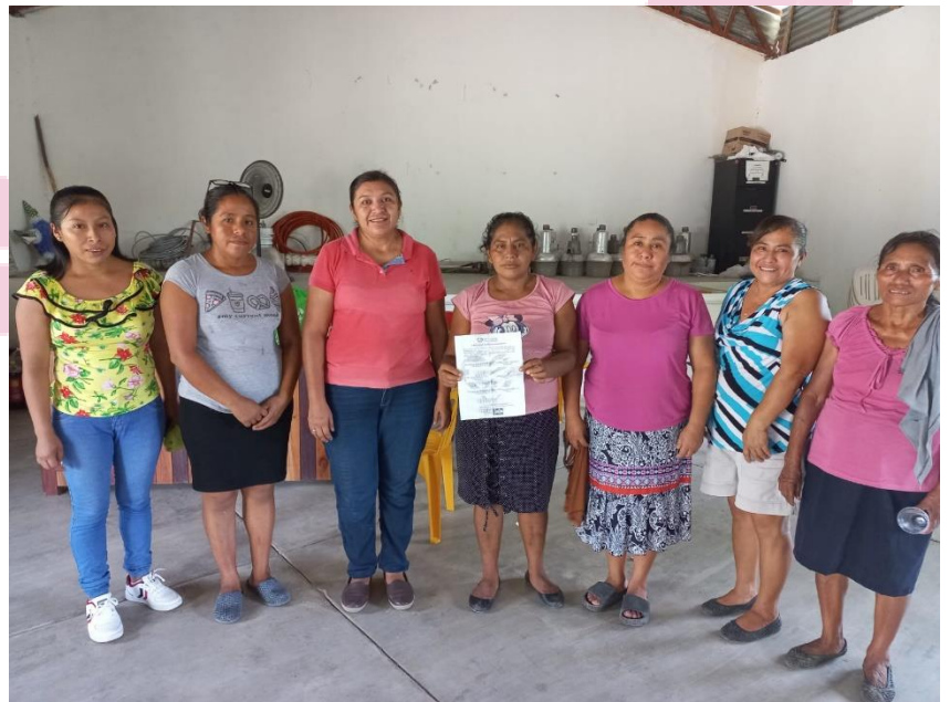
Comité de Red de mujeres emprendedoras en la localidad de Cuayo, Chalco