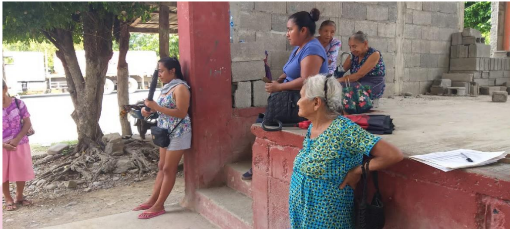
Platica de prevención en la localidad de Jalpilla.

25 de junio Día Naranja se colocó un Andador Gastronómico y Artesanal alrededor del Jardín Municipal