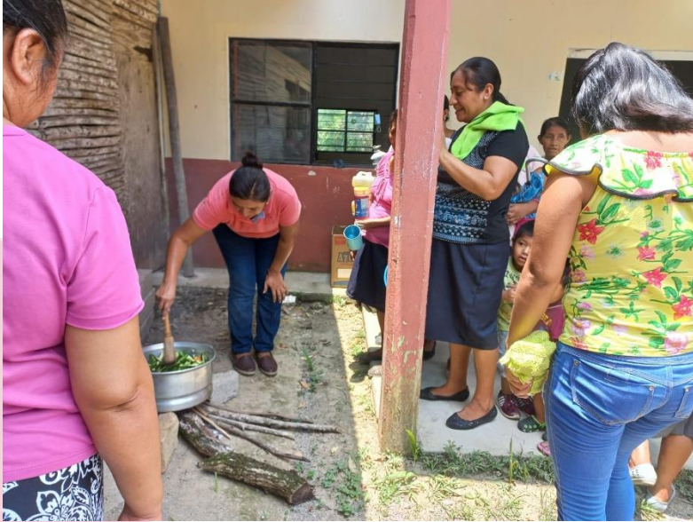
Taller de Curtido de chiles en escabeche en la localidad de Cuayo, Chalco