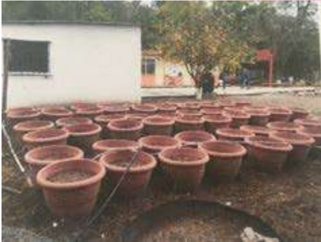
Huerto Escolar en la Comunidad de Vaqueros, muestra la condición en que fue recibido en total abandono.