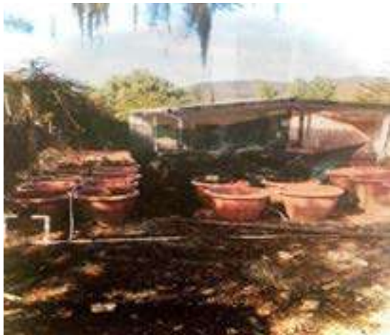
Huerto escolar en la Comunidad el Aguacate, así fue recibido en total abandono.