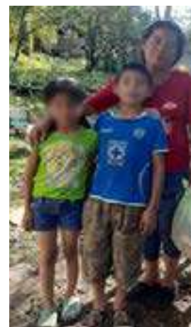
La Nueva Reforma, Rayón.

Así mismo se brindaron pláticas y talleres referentes a los derechos de los niños, niñas y adolescentes; educación socioemocional, 26 de junio -