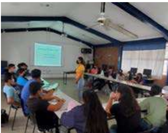
Taller de Educación socioemocional en Esc. Secundaria Técnica #10 de la Cabecera municipal de Rayón, S.L.P