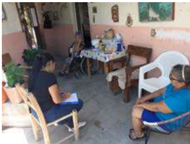
Realizando Estudios Socioeconómicos.

Se logró la colaboración con el Sistema Municipal para el Desarrollo Integral de la Familia de los municipios de Cárdenas, Rioverde y Tamasopo.