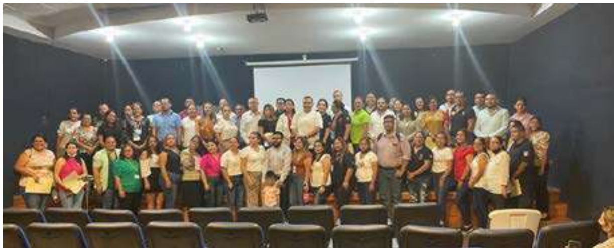
Capacitación sobre “La Prevención del Suicidio”, por el personal de Jurisdicción Sanitaria No IV.