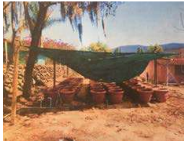
Huerto Escolar en la Comunidad el Aguacate, al día de hoy se encuentra en rehabilitación.

Con estos avances se logra que las niñas y niños tengan alimentos saludables en el comedor escolar, ya que además son cosechados por los padres de familia que, a su vez es para beneficio de todos los involucrados de la misma institución.