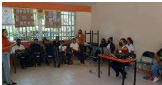
Impartiendo taller de "Prevención del Embarazo en Adolescentes"