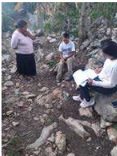
Comunidad Las Guapas, Rayón

Nuestro objetivo ha sido mejorar la calidad de vida las personas, grupos y comunidades desde la perspectiva de los Derechos Humanos, por lo que se dio atención a una población de 596 personas, de las cuales se brindaron 109 asesorías y orientaciones, generando canalizaciones a los usuarios a los diferentes departamentos inter o intra institucionales brindando un servicio asistencial para obtener una atención conjunta e integral, brindando el seguimiento al plan de intervención de