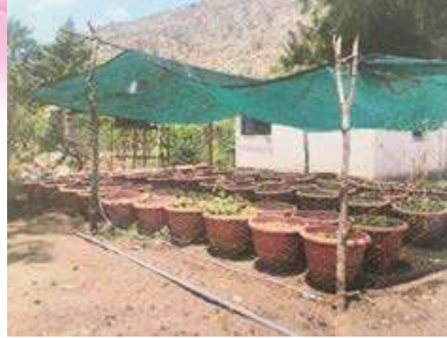
Huerto Escolar en la Comunidad de Vaqueros, actualmente se encuentra rehabilitado y produciendo.