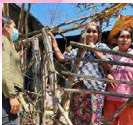
La Chicharrilla, Rayón.

tiene como principal objetivo la solución pacífica de conflictos en las familias el cual se impartió en la capital potosina, estas capacitaciones buscan afinar los conocimientos y fungir como guía a la resolución de situaciones complejas o de cambio vital y que necesitan de un acompañamiento basado en la ética profesional.