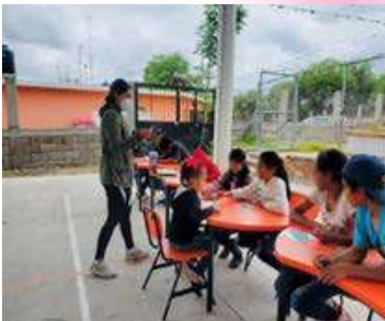
Juego de lotería promoviendo los derechos de los niños en Esc. Primaria de la Comunidad El Ranchito.