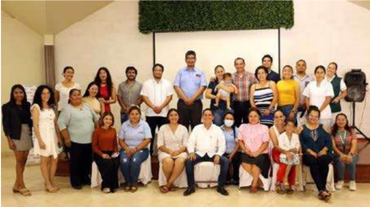
Jornada Académica (por el Día Nacional del Psicólogo), en la cual se tomó capacitación sobre los temas de “La Importancia de los Cuidados Prenatales y Perinatales”.