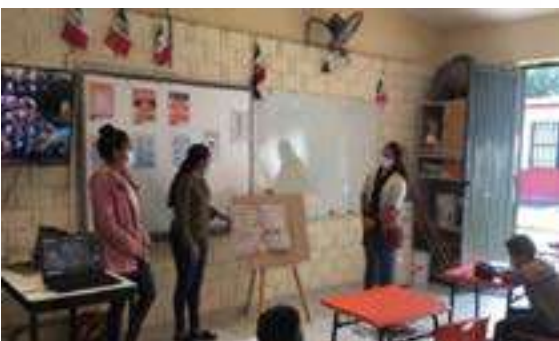
Taller "NO DISCRIMINACION, SI IGUALDAD" en Esc. Primaria Fco. González Bocanegra de la Cabecera Municipal, en donde el dpto. de Bienestar familiar llevo a cabo este taller en compañía de la Psicóloga y Trabajadora social del

El área de Bienestar Familiar cuenta con una capacitación continua, con la finalidad de brindar una mejor atención en cada visita a las instituciones educativas o bien en la ejecución de un taller o difusión de alguna campaña, con ello se ha logrado mayor conocimiento de los temas y calidad de servicio.