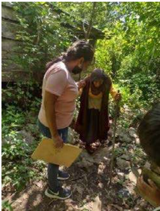
Reporte de adulto mayor en la comunidad de "El Sabinito"

A efecto de garantizar al máximo sus derechos se atendieron reportes de abuso y violencia, por lo que se realizaron 47 visitas domiciliarias tanto en cabecera como en las diversas comunidades de este municipio, acercando con esto los servicios de este SMDIF a las personas que más los necesitan sin importar en que parte del municipio se localicen.