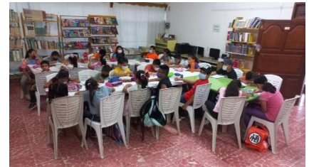
CURSO DE INGLES