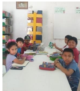
TALLER DE LECTURA