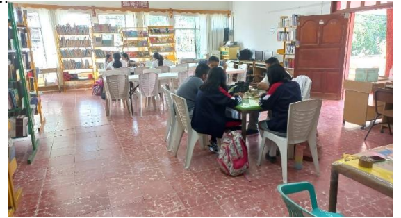
AREA DE CONSULTA E INVESTIGACION