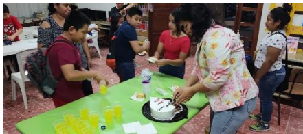
FESTEJO 14 DE FEBRERO