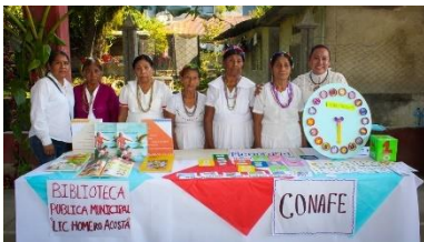
ACTIVIDAD DE PROMOCION 21 DE FEBRERO JALPILLA