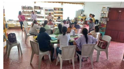
SERVICIO DE ESPACIOS ZONA 012 SECTOR 07