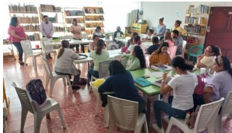
SERVICIO DE ESPACIOS A ZONA 012 SECTOR 07