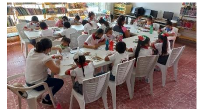
VISITA GUIADA 16 DE FEBREERO