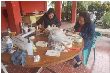
RESTAURACION DE LIBROS