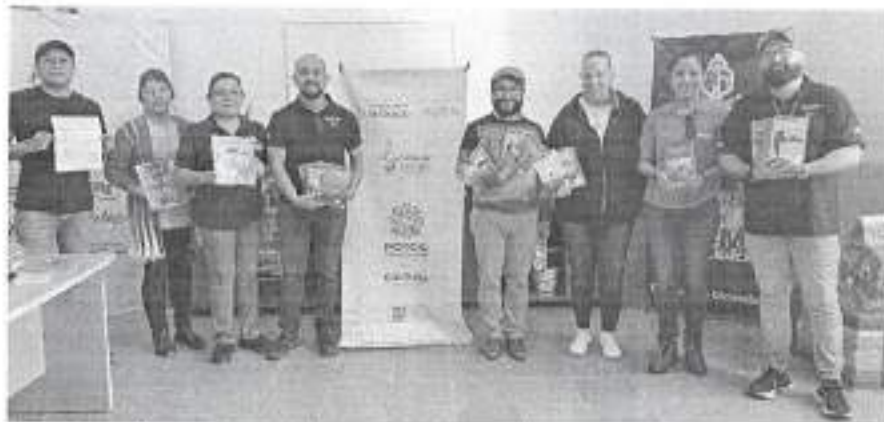
Reunión en Ciudad del Maíz, S. L. P., el 24 de noviembre de 2022