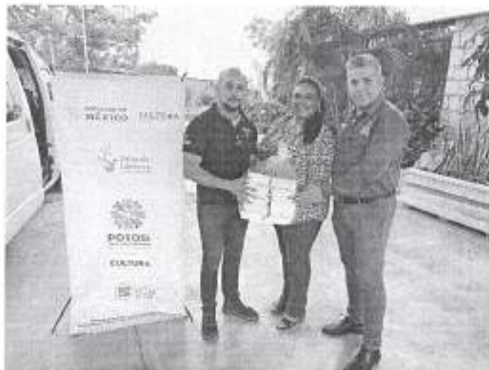
Reunión con mediadores de lectura el 24 de noviembre de 2022 en Ciudad Valles, S. L. P.