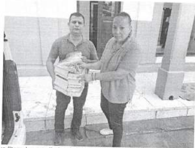
Entrega de acervo literario a mediador de lectura, en Aquisión, S. L. P., el 25 de noviembre de 2022