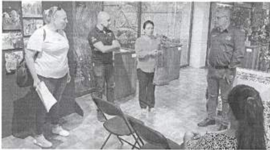
Reunión con mediadores de lectura el 24 de noviembre de 2022 en Ciudad Valles, S. L. P.