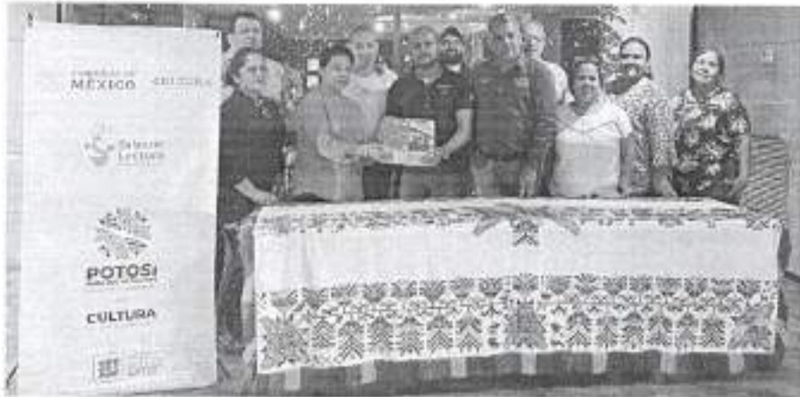
Reunión con mediadores de lectura el 24 de noviembre de 2022 en Ciudad Valles, S. L. P.