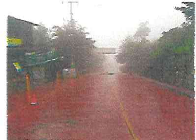
Otra vista de la calle