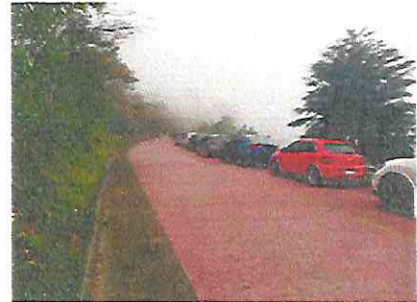
Pocos autos de visitantes