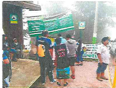
La lona ya colocada