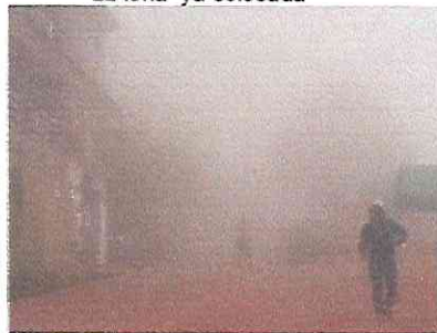
Poca visibilidad por la niebla