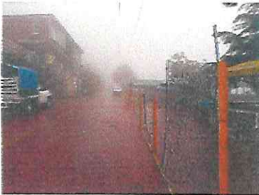
La calle de acceso completamente vacía