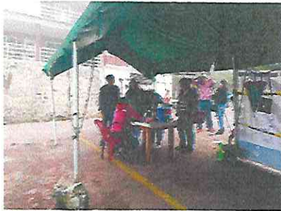
Filtro y registro de visitantes