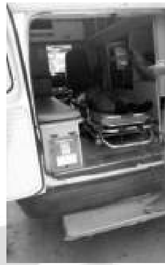
SE BRINDA ATENCIÓN A PERSONA VULNERABLE, LA CUAL SE TRASLADA AL ALBERGUE DEL HOSPITAL SANTA CATARINA.