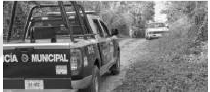
SE RETIRA ABEJAS DENTRO DE ÁRBOL.