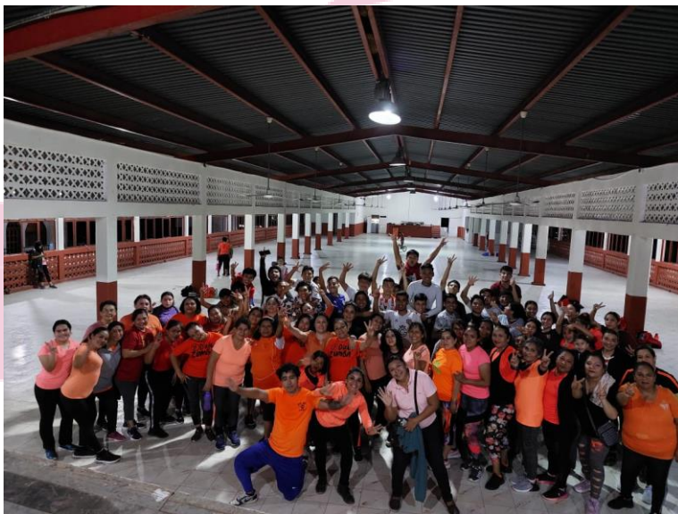
Se impartió zumba en el casino municipal, con el objetivo de conmemorar el día naranja de la no violencia contra la mujer.