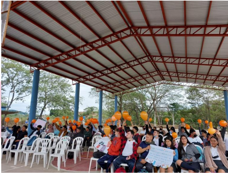
Se impartió plática sobre violencia en el noviazgo en el Colegio de Bachilleres Plantel 33, para conmemorar el día naranja de la no violencia contra la mujer.