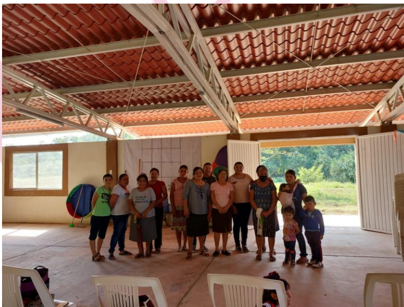
Comité de Red de Mujeres Emprendedoras de la localidad Arroyo de En medio.