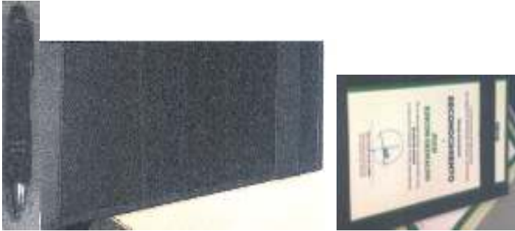
(Partidas 1,2 y 3)