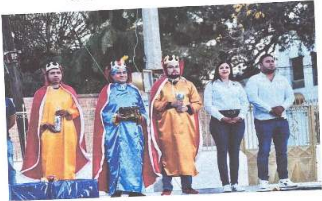
06 de enero compartiendo la rosca de reyes