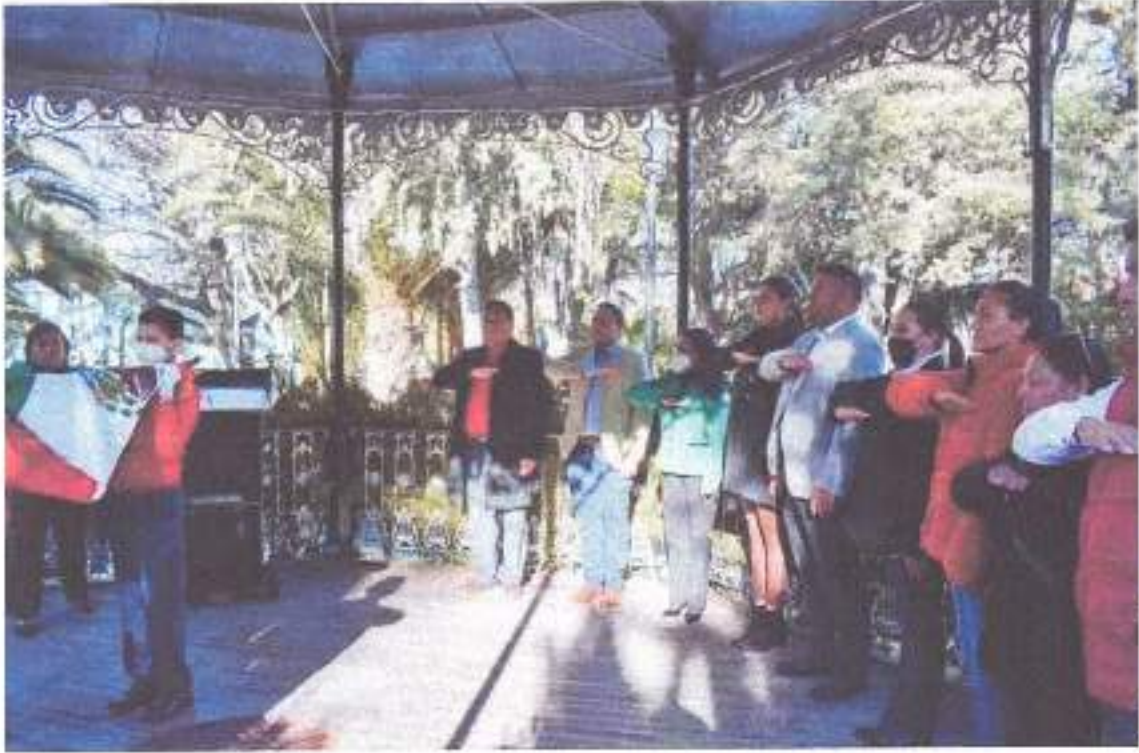
ALUMN DELA AGRICULTURA