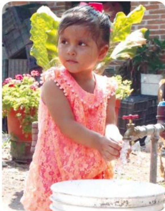
Más agua para todos los potosinos.