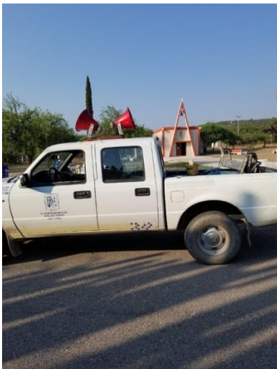
Perifoneo en comunidades