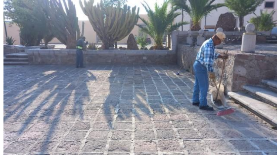
Barrido de plaza de Bocas