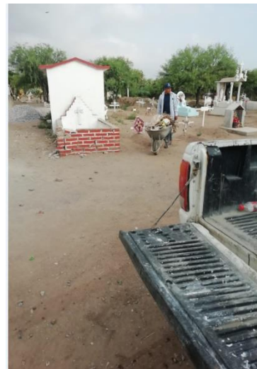
Limpieza de panteón No. 2