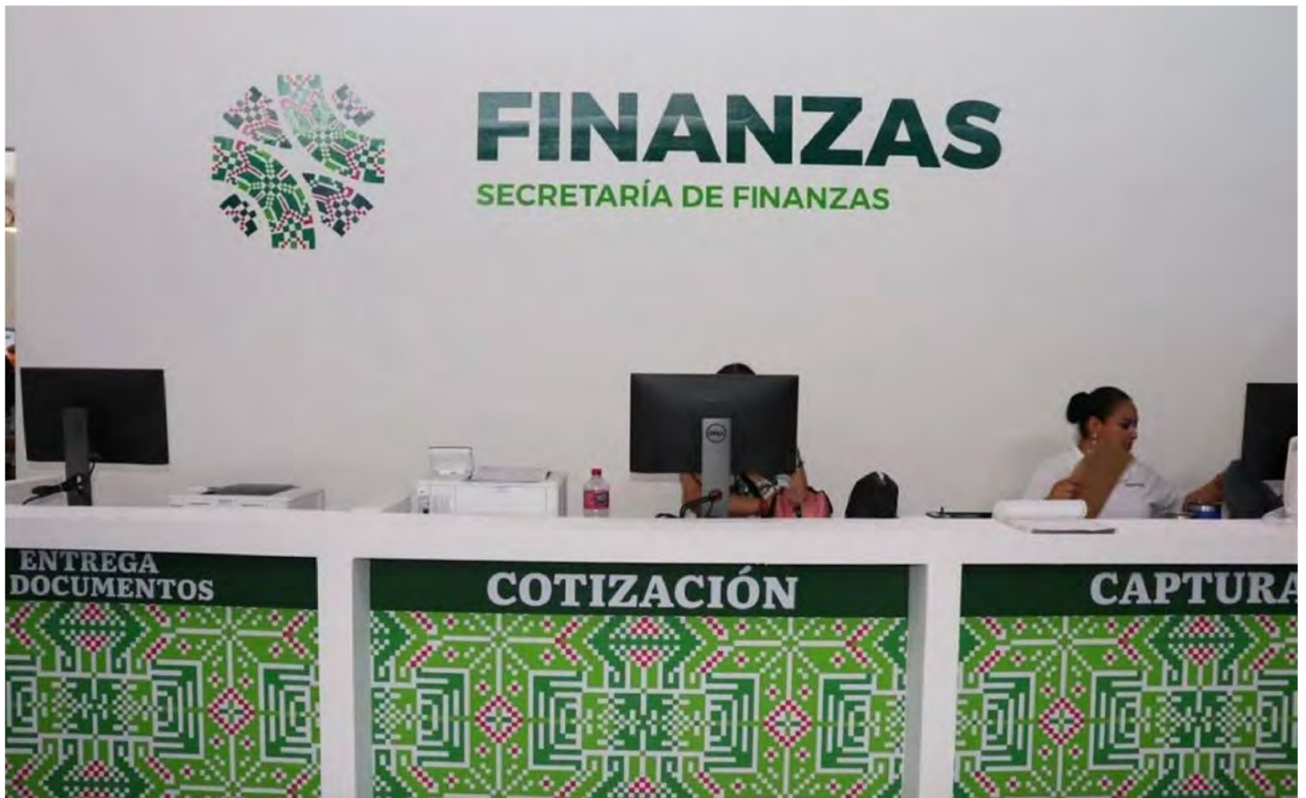
Hackean a Secretaría de Finanzas de San Luis Potosí; suspenden servicios.