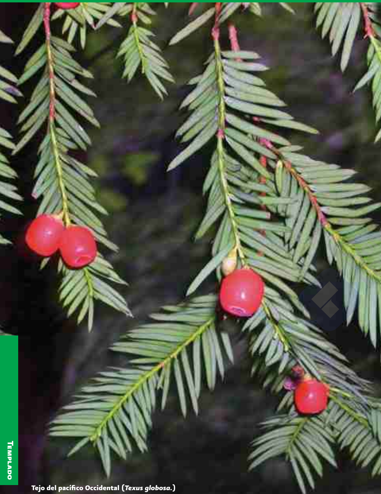
Tejo del pacífico Occidental ( Texus globosa .)