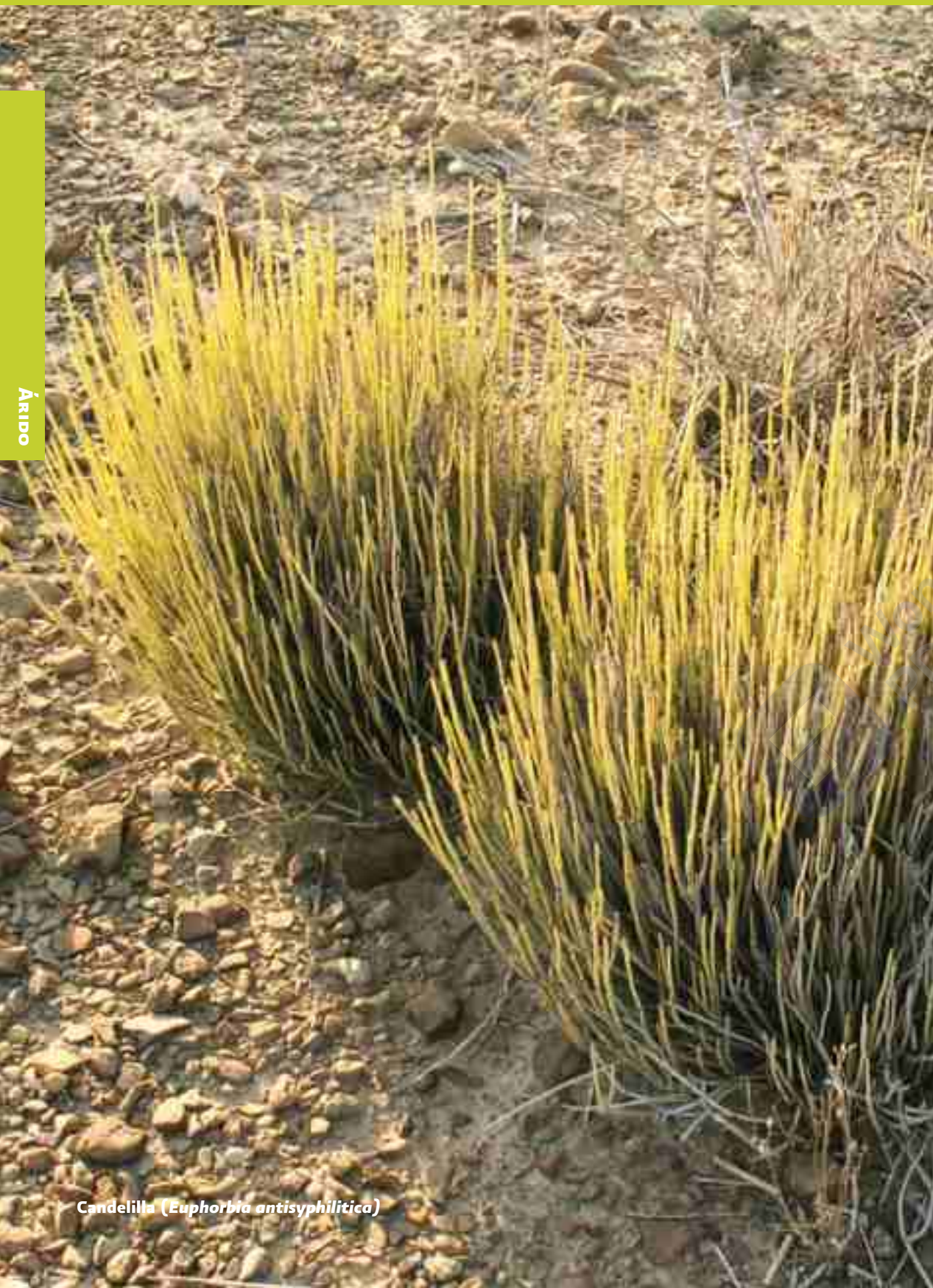
Candelilla ( Euphorbia antisiphilitica )

“Diseño de un proceso de alto rendimiento en la extracción de cera de candelilla de alta calidad y formulación de productos de uso final a partir de la cera preparada” (Clave: 91633). El objetivo es desarrollar un proceso de extracción de cera candelilla de alto rendimiento y mayor calidad que el proceso convencional, a partir de las modificaciones hechas al diseño de las pailas (calderos de hierro) con nuevos agentes extractores de menor costo y biodegradables. Dicho proceso puede ser instalado en los ejidos y usado por los silvicultores para un mejor aprovechamiento de la cera candelilla.