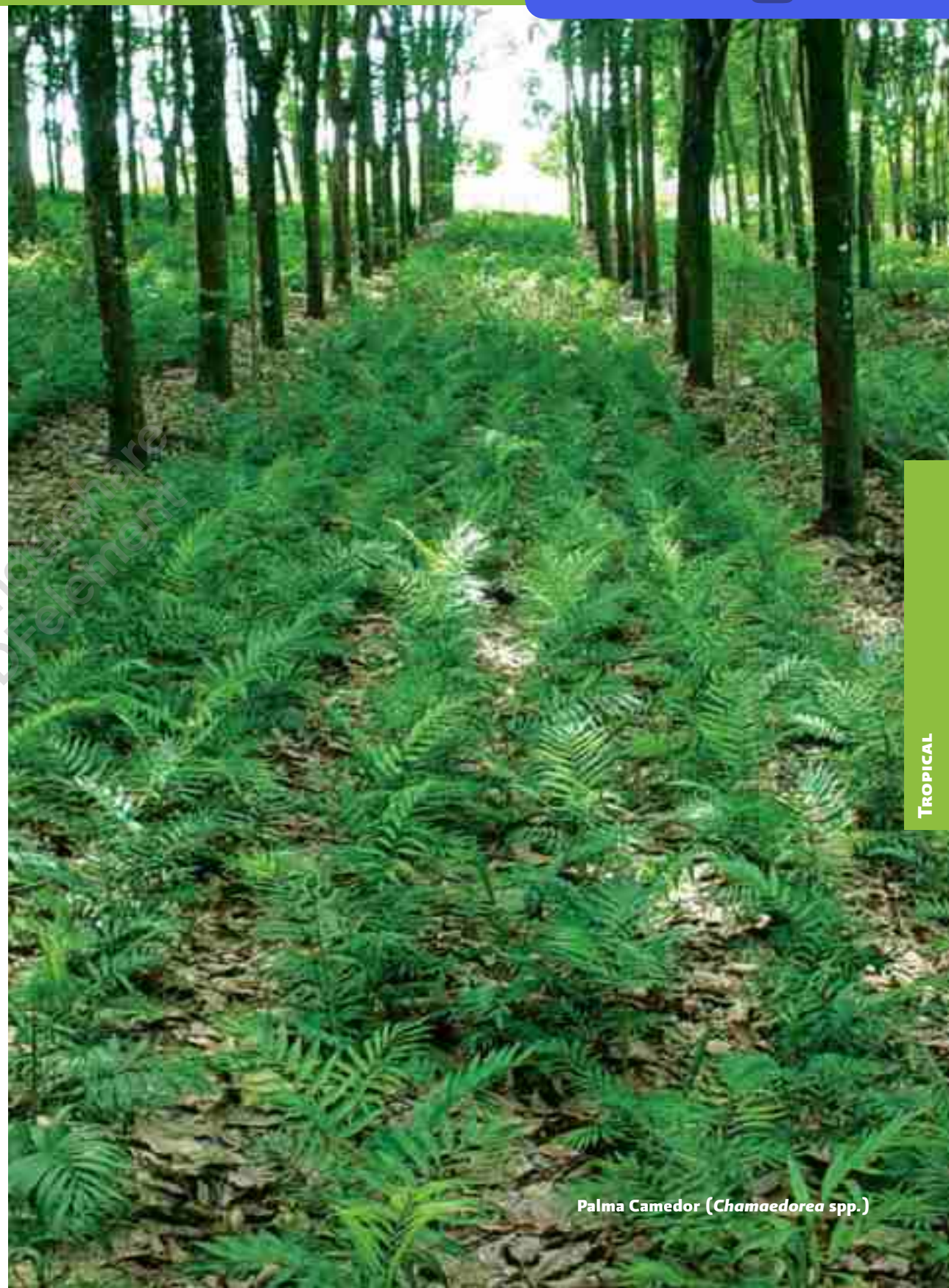
Palma Camedor ( Chamaedorea spp.)

Distribución local: Introducidas al país con plantaciones en Oaxaca, Tabasco, San Luis Potosí, Veracruz y Chiapas.