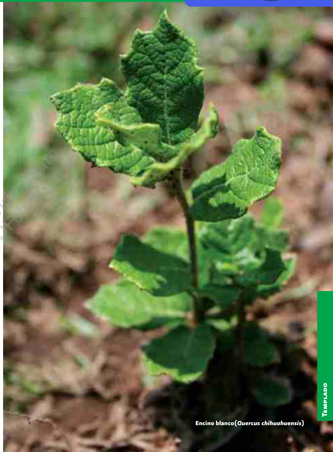
Encino blanco ( Quercus chihuahuensis )

“Los macromicetos de algunas localidades de los municipios de Amealco, Cadereyta y San Joaquín” (Clave: 10124). Se generó el Manual de los macromicetos de algunas localidades del estado de Querétaro, el cual es una guía descriptiva e ilustrada que ayuda a la identificación de los diferentes hongos comestibles encontrados en dicho estado.