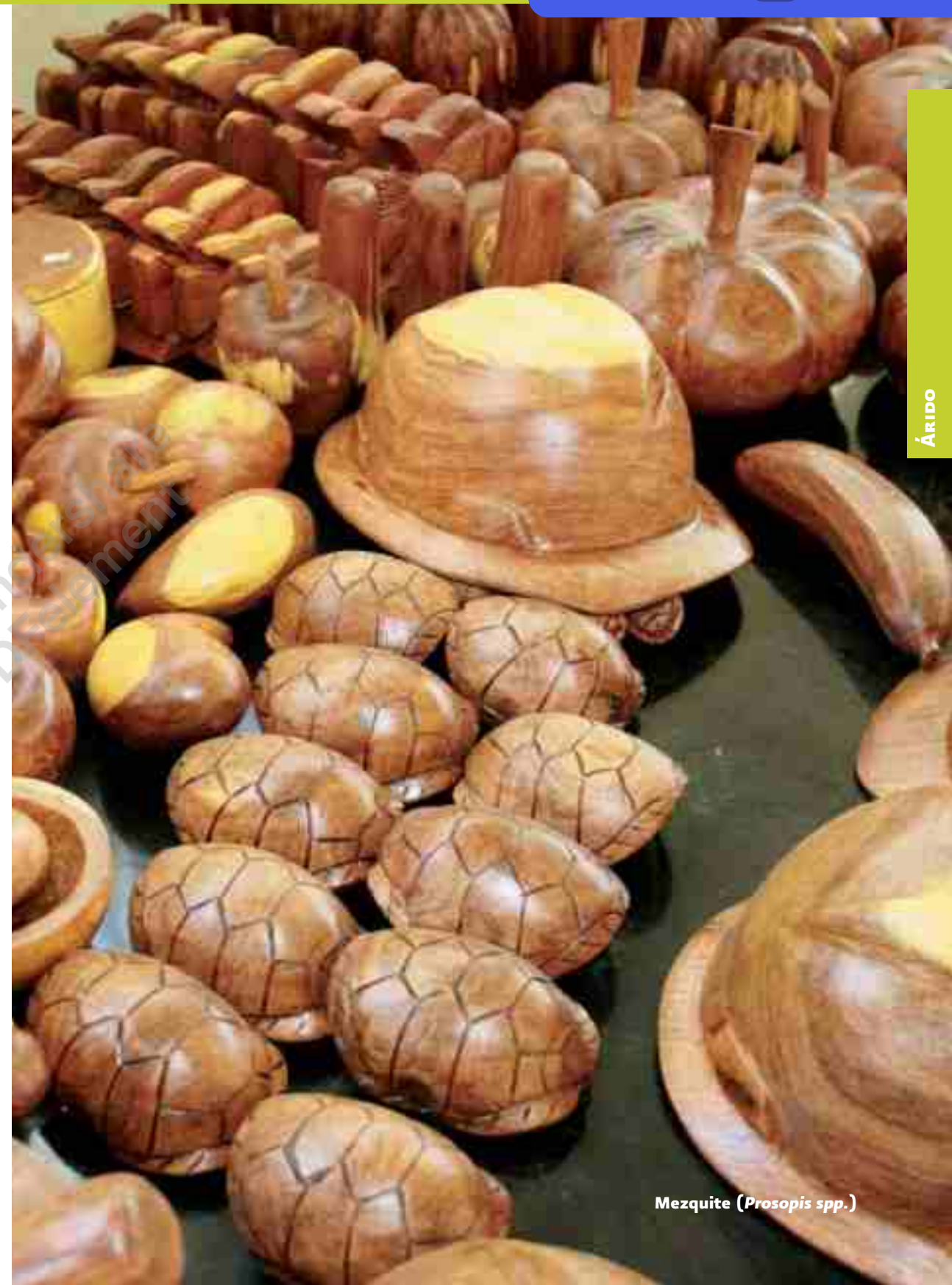
Mezquite ( Prosopis spp.)

“Estimación del valor económico del bosque de mezquite en el municipio de La Paz, Baja California Sur, para determinar el pago por servicios ambientales” (Clave: 14815). Se determina