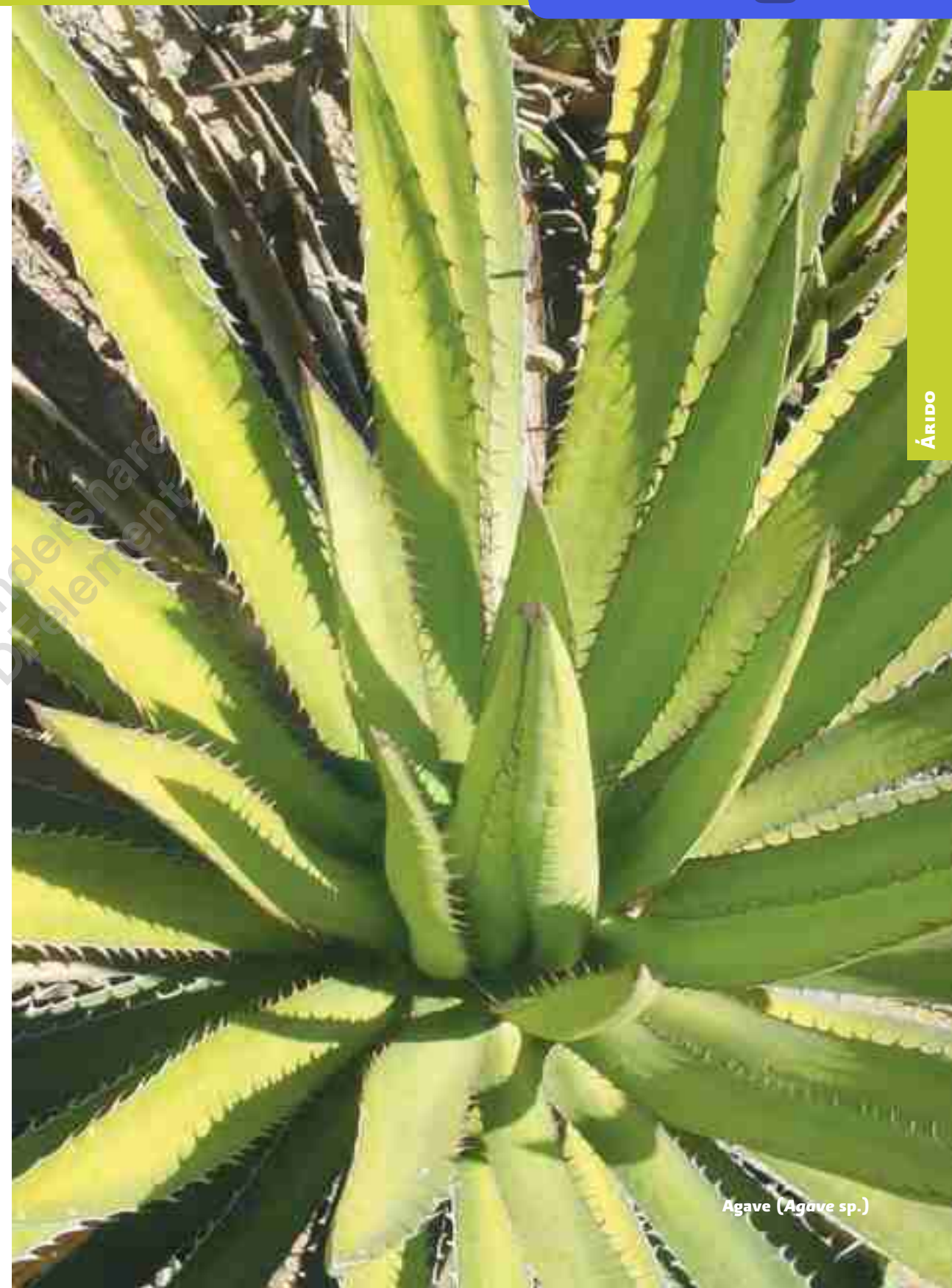
Agave ( Agave sp.)