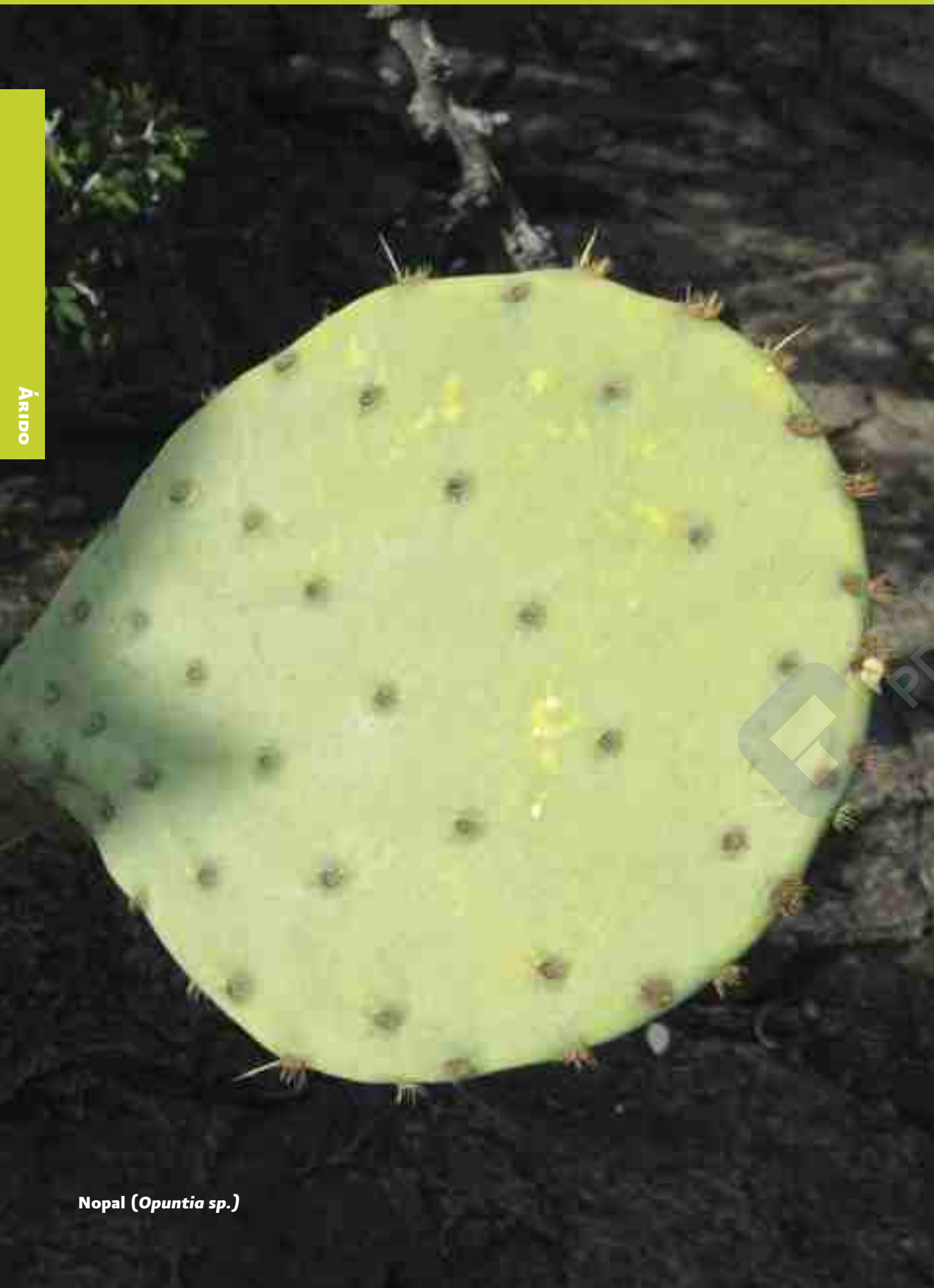
Nopal ( Opuntia sp. )

“Efecto fungicida y toxicológico del aceite esencial del orégano ( Lippia palmeri )” (Clave: 33). Se investigaron y documentaron características propias de la germinación de semillas de orégano provenientes de dos sitios silvestres del estado de Sonora. Estos sitios fueron comparados para evaluar el efecto fungicida e insecticida de los aceites esenciales presentes en las semillas del orégano.