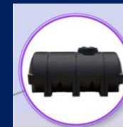
Tanque nodriza horizontal