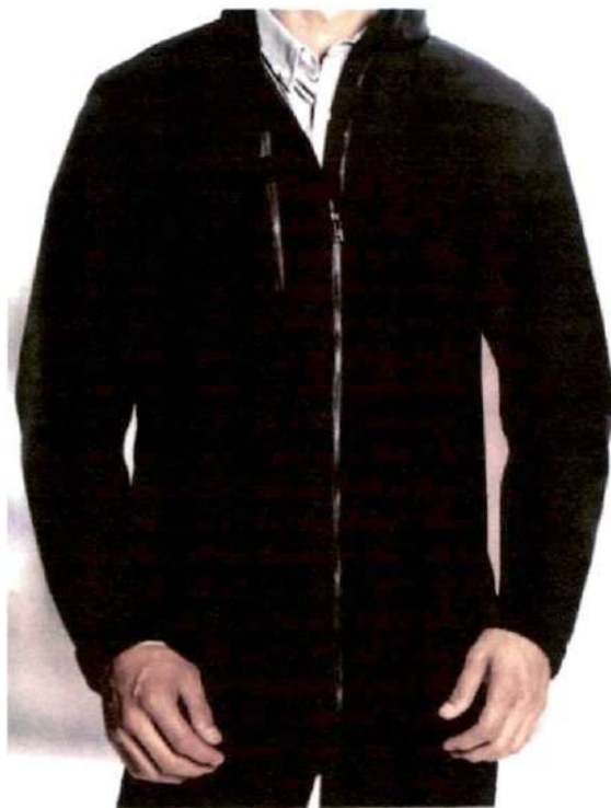
Imagen con modelo de referencia

En caso de no cotizar, favor de enviar carta de manifestación.