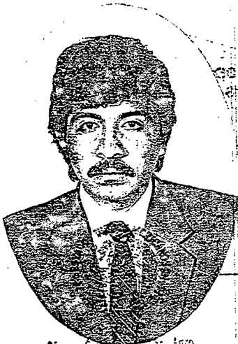
Direc. Gral. de Tec. Agro. Dpto. de Normalidad y Servicios Escolares

en atención a que comprobó haber terminado los estudios requeridos conforme a los planes y programas correspondientes, en vigor en el Instituto Tecnológico Agropecuario No. 12 de Linares, N. L.