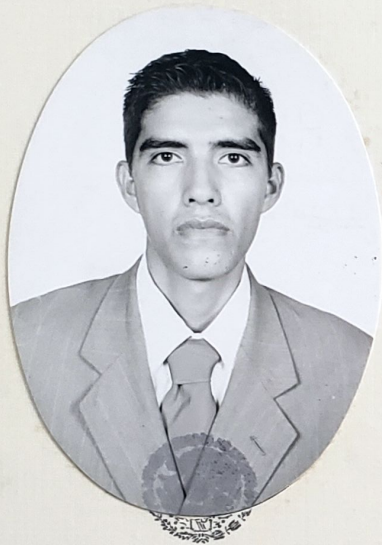
SISTEMA EDUCATIVO NACIONAL SAN LUIS POTOSÍ