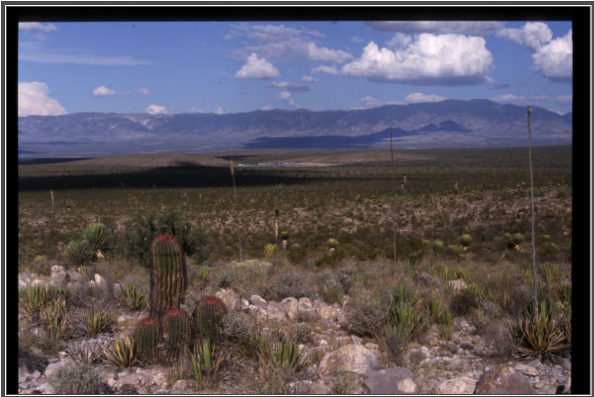
Fotografía No. 122 Diversidad de ecosistemas en el Municipio de Catorce