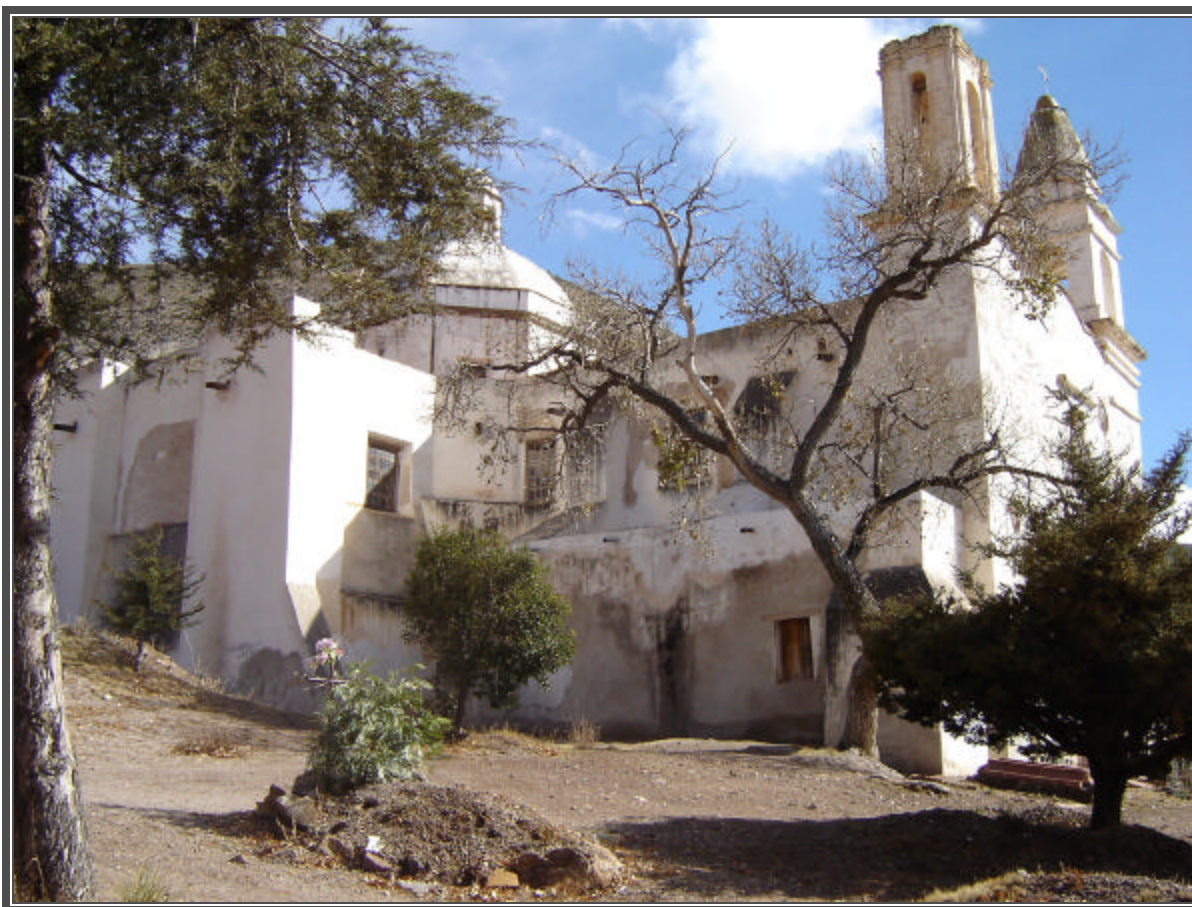
Fotografía No. 121 Templo emplazado en el interior del Panteón de Real de Catorce.