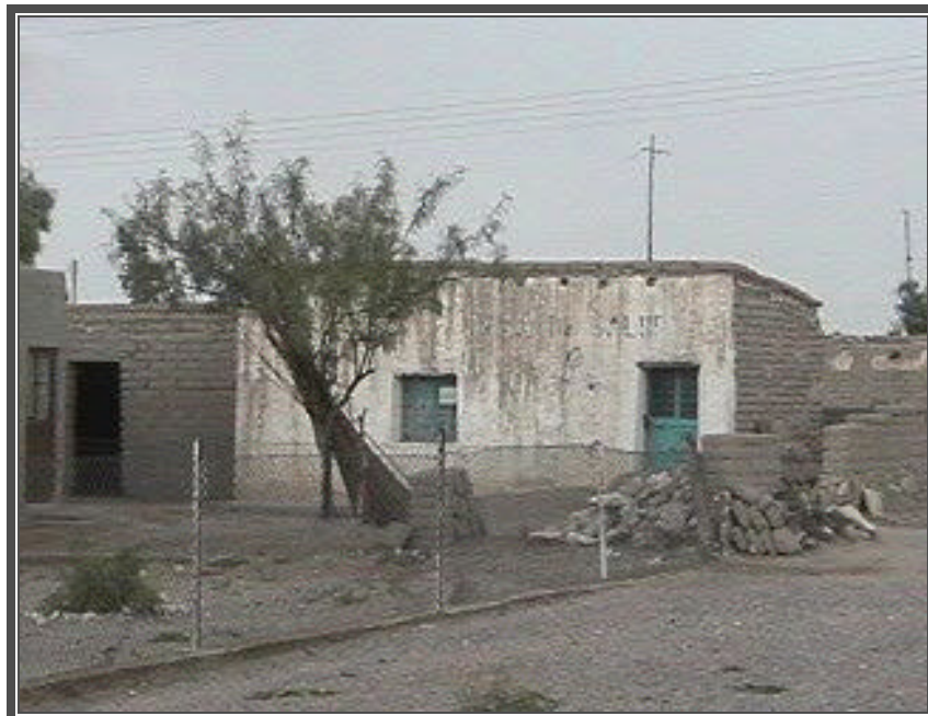
Fotografía No. 120 Vivienda tipo realizada con materiales de la región, localidad de Potrero