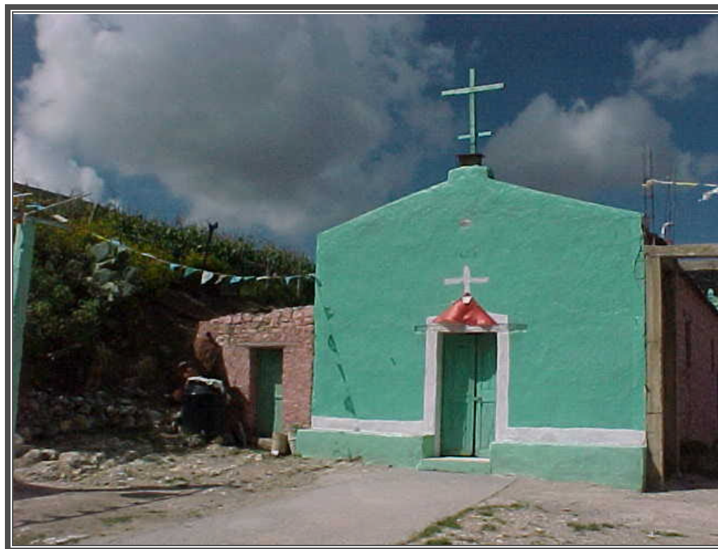
Fotografía No. 127 Templo de la localidad de Alamitos de los Díaz