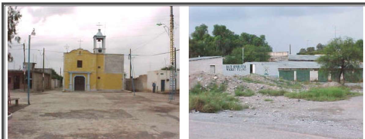
Fotografías No. 125 y 126 Templo y Estación de Policía en la localidad de Estación Wadley