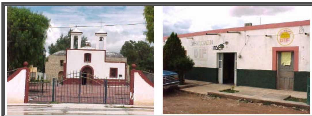
Fotografías No. 123 y 124 Templo y DIF de la localidad de Estación Catorce