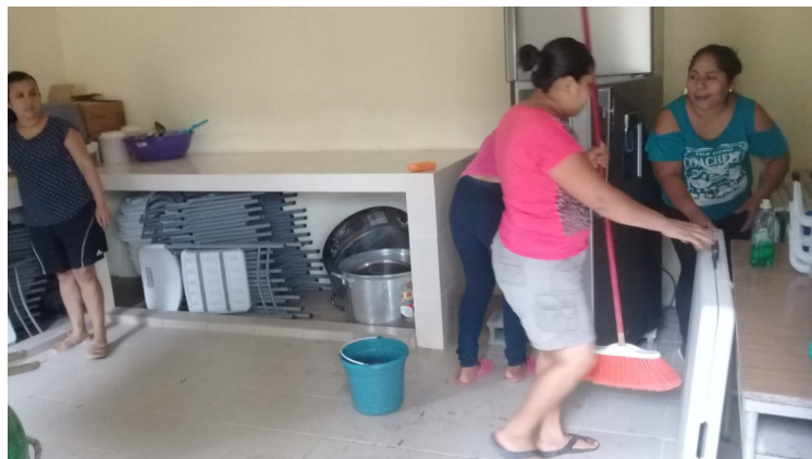
Xoloco, Primaria Emiliano Zapata.