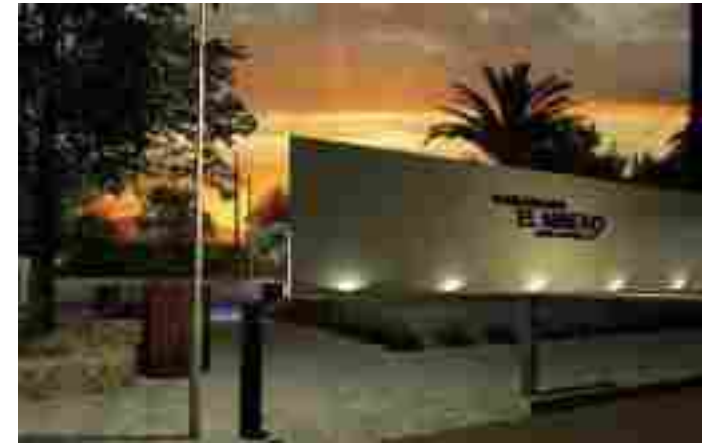
Plaza "El Minero" Localidad "El Refugio (La Luz)"