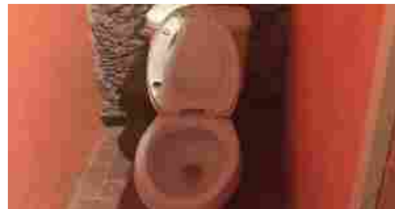
REMODELACION SANITARIOS DEL PALENQUE REAL DE CATORCE