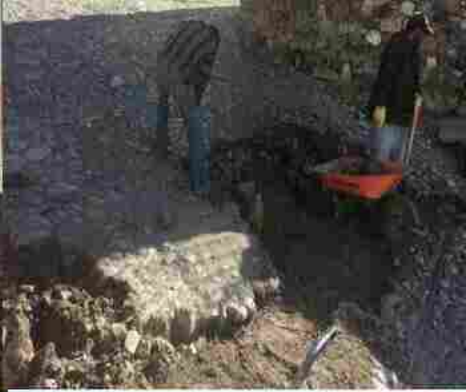
Rehabilitación de calles Real de Catorce