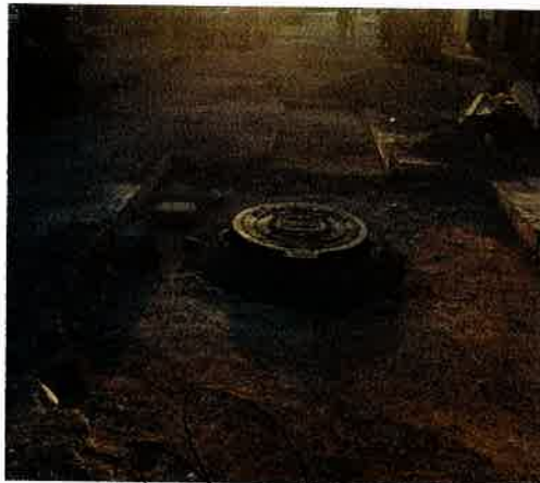
SUMINISTRO E INSTALACIÓN DE BROCALES DE PEAD PARA POZOS DE VISITA CON REJILLA ABIERTA.