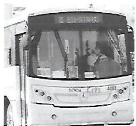
La ejecución de proyectos de movilidad también contribuirán a brindar seguridad en el traslado, no sólo del transporte de personal (DANIEL ESQUIVEL)

La saturación de vehículos genera retrasos en los tiempos de traslado, y estos a su vez provocan prisas innecesarias