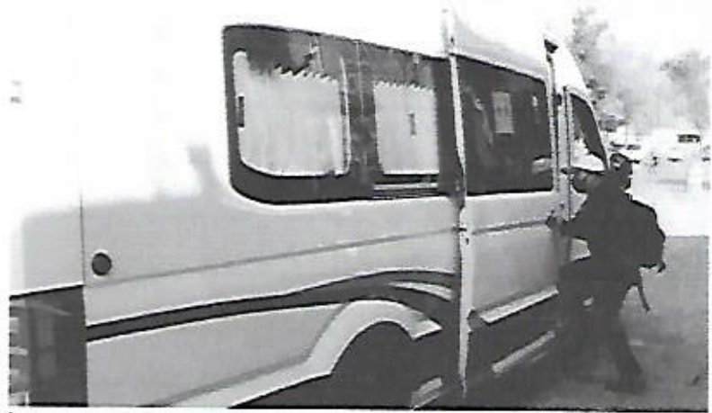
Las empresas de transporte de personal deben invertir en capacitar a sus operadores, también se tienen que dar las pautas para tener una buena infraestructura (DANIEL ESQUIVEL)

En ese sentido, el empresario consideró que, la construcción de la Vía Alterna y la ejecución de otros proyectos de movilidad también contribuirán a brindar seguridad en el traslado, no solo del transporte de personal sino de los potosinos en general, pues