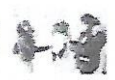
El alcalde de Salinas...