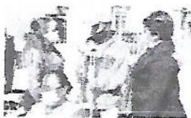
El alcalde de Salinas...