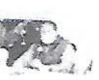
El alcalde de Salinas...