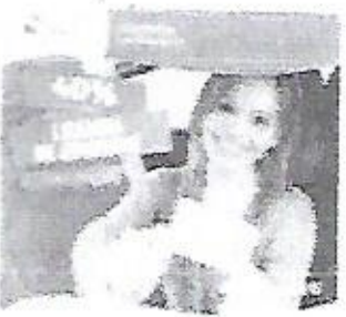
El alcalde de Salinas...