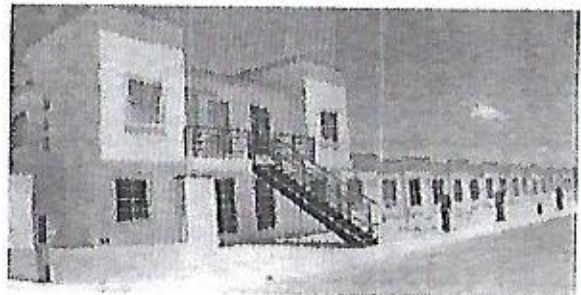
Tanto en las 17 fraccionamientos en proceso de construcción