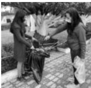
CAMPAÑA "AXTLA TE QUIERO LIMPIO"