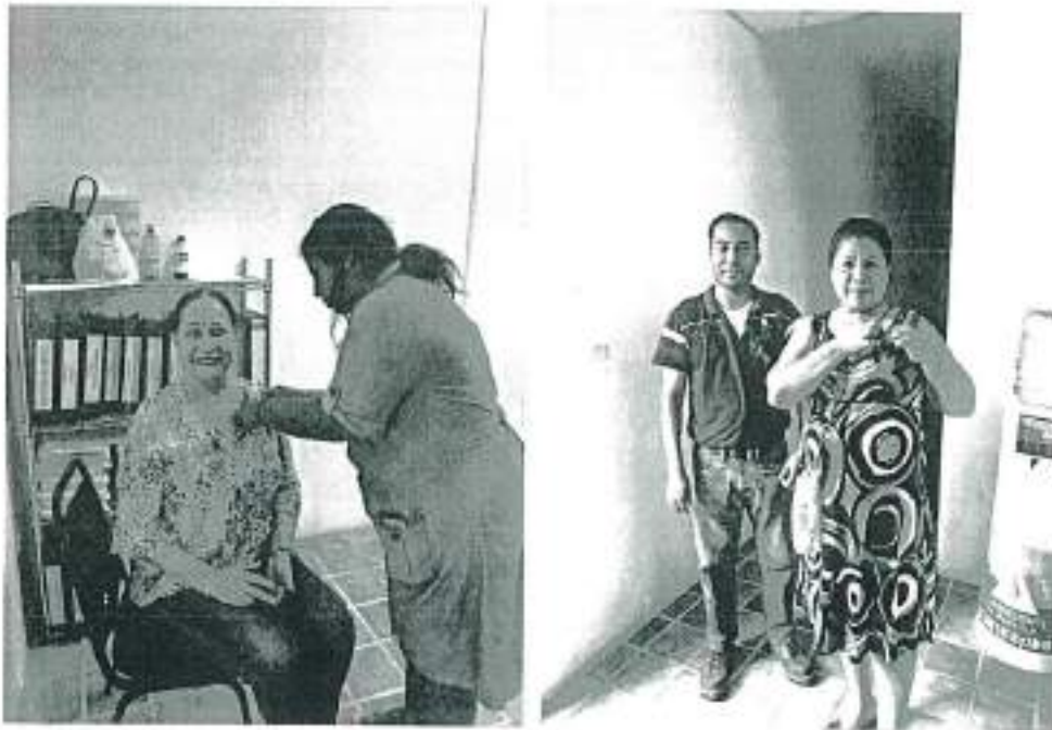
Coordinación Municipal de Derechos Humanos | 014