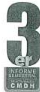
Informe Semestral de Actividades CMDH | 007