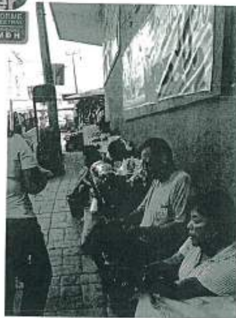
Informe Semestral de Actividades CMDH | 012

Handwritten signatures and scribbles in blue ink are scattered across the page, including a large signature at the bottom right and several smaller ones on the right side.