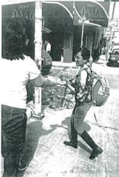
Informe Semestral de Actividades CMDH | 010