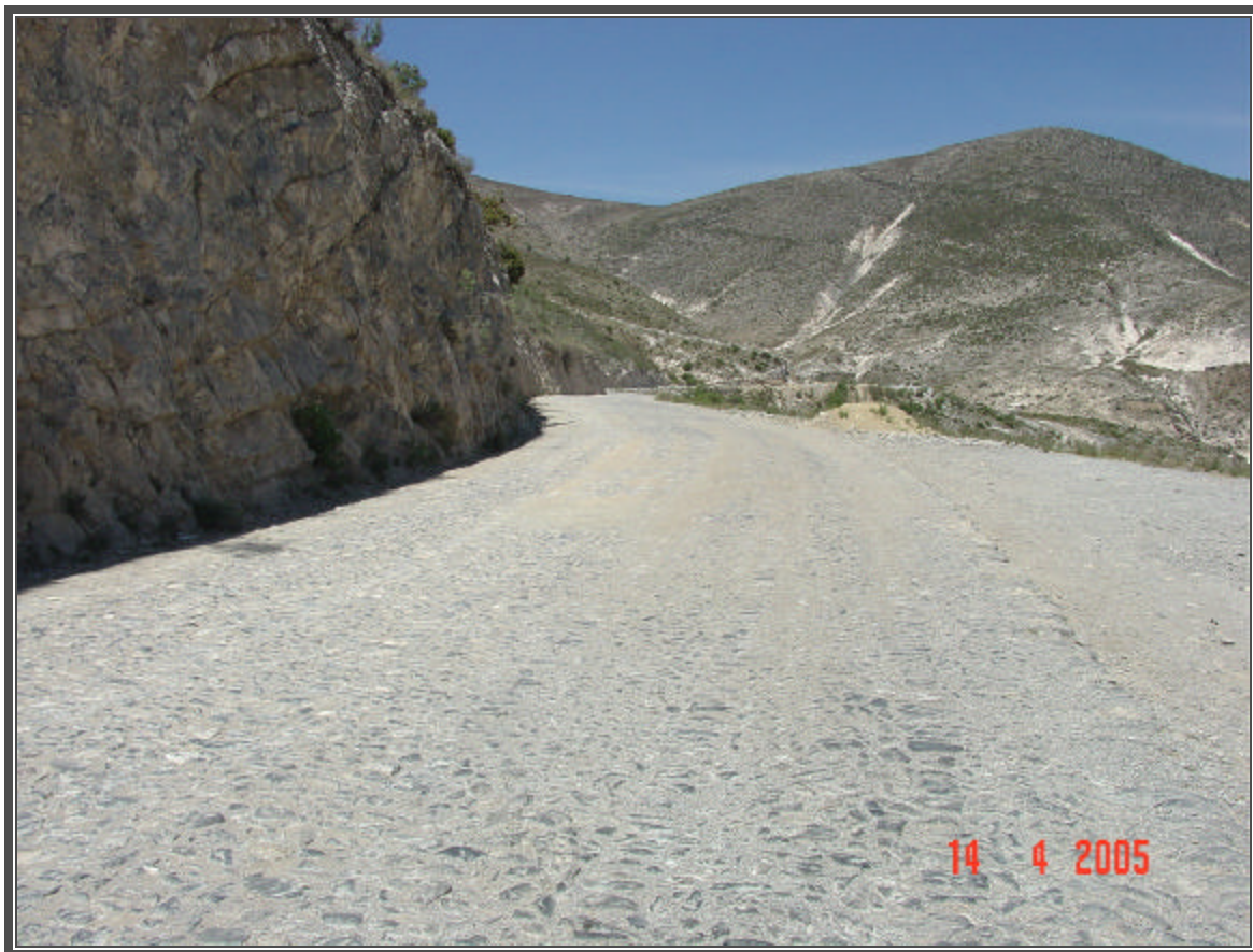
Fotografía No.60 Pavimentos de la carretera estatal a Real de Catorce