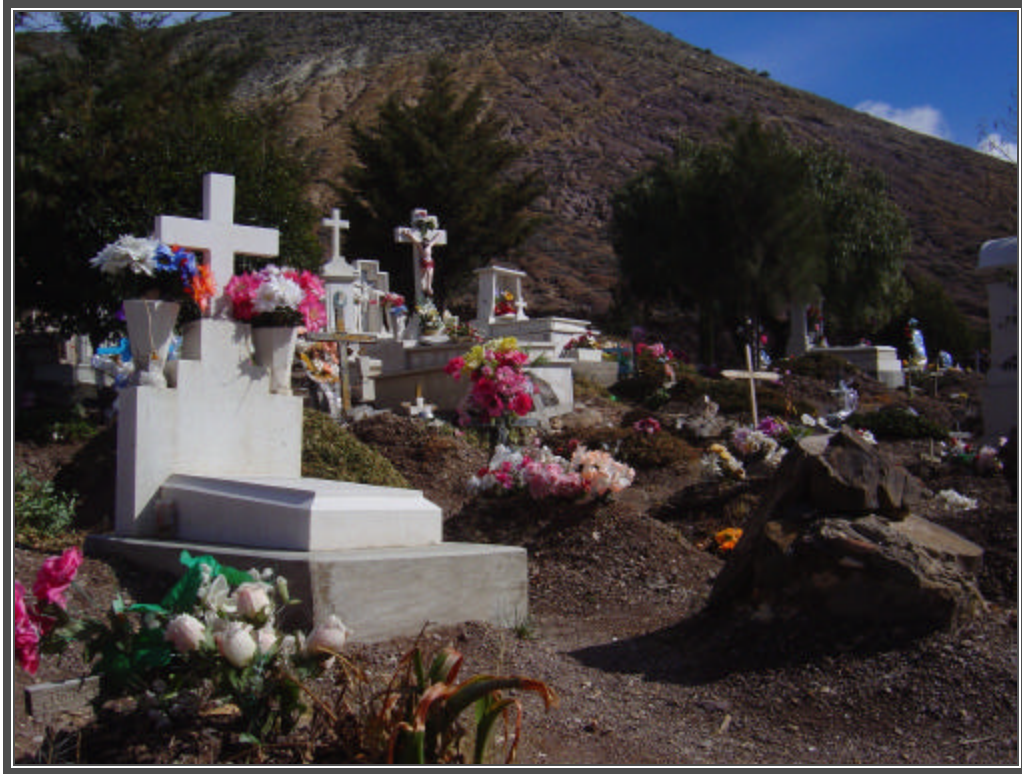
Fotografía No. 61 Cementerio de Real de Catorce