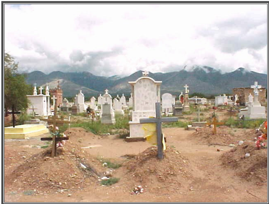
Fotografía No. 62 Cementerio de Wadley