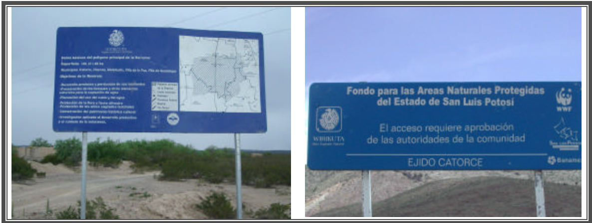
Fotografías No. 63 y 64 Anuncios y señales en el Municipio de Catorce, zona natural protegida de Huiricuta.