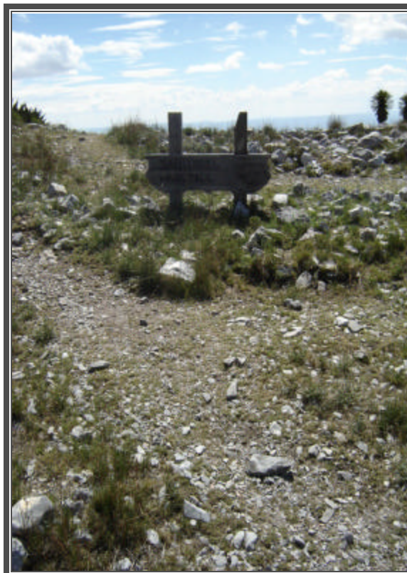
Fotografía No. 65 Señalética en el camino al Quemado.