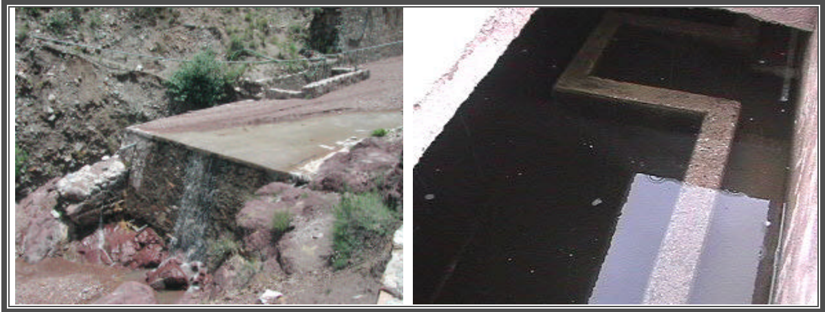
Fotografías No. 56 y 57 Infraestructura hidráulica, depósitos de agua potable

La administración de este servicio se encuentra a cargo del Comité de Agua Potable del Ayuntamiento y en algunas localidades esta a cargo del ejido. En el municipio, además de la cabecera municipal, las localidades que cuentan con el servicio son Santa María del Refugio, Estación Catorce, Estación Wadley, San José de los Quintos, Ranchito de Coronados, San Antonio de Coronados, Guadalupe el Carnicero, La Luz ( El Refugio ), El Potrero, Poblazón, y Refugio de los Amayas. Tanque de Dolores, Tanque de Arenas, La Milpita, Santa Cruz de Carretas, Los Catorce, Adjuntas, Jesús de Coronados, La Leona, Las Margaritas, Mastranto, San José de Coronados, y San Juan de Matanzas.