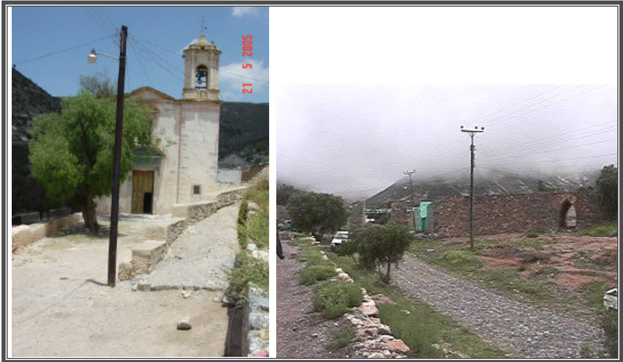
Fotografías No. 58 y 59 Tipo de alumbrado con el que se cuenta en las localidades de La Luz y Potrero

Para la prestación del servicio de alumbrado público el Ayuntamiento se encarga del pago de energía, el departamento existente en el municipio cuenta con un encargado de mantenimiento. Para este tipo de servicio se tienen cuarenta y cinco usuarios en el municipio 69 .