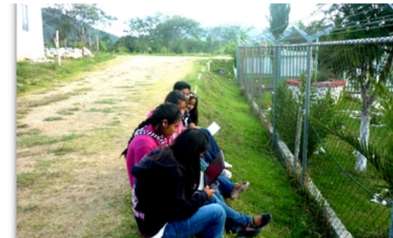
Programa de Cobertura Social

Autor Secretaría de Comunicaciones y Transportes