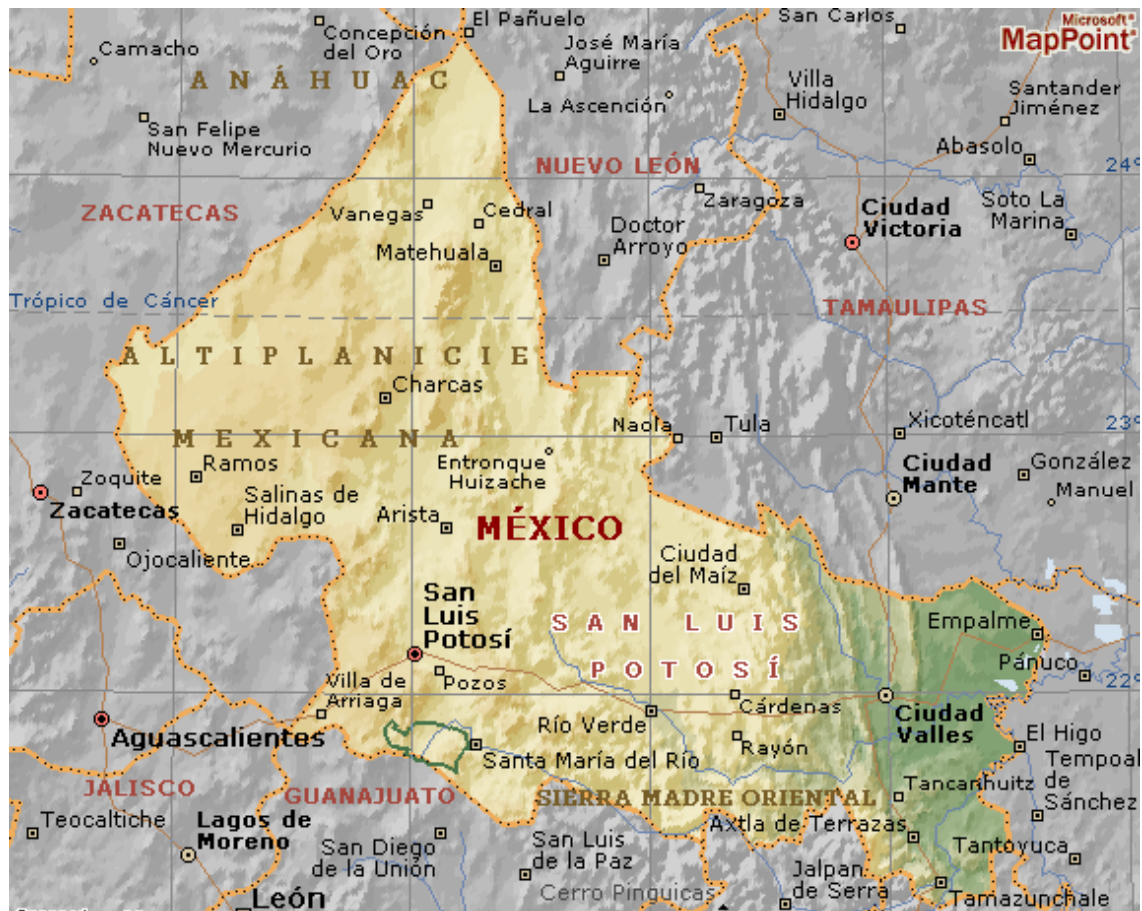
Figura 4. Ubicación del Estado de San Luis Potosí.

La entidad tiene una superficie de 60,982.80 km 2 la cual representa el 3.1% de la superficie total nacional. Se localiza: al norte 24° 29', al sur 21° 10', de latitud norte; al este 98° 20', al oeste 102° 18', de longitud oeste. Lo cruzan: oriente-poniente, el Trópico de Cáncer y norte-sur el Meridiano 100.