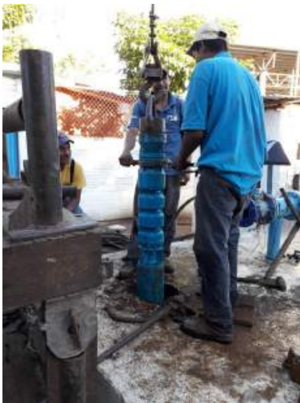
POZO ZAPATA EXTRACCION DE EQUIPO DAÑADO.

EL REFUGIO, CD. FERNANDEZ, S.L.P. Jueves 26 de Marzo del 2020