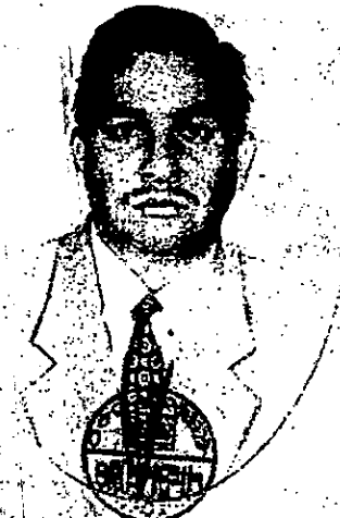
ESCUELA NORMAL SUPERIOR DE CD. MADERO TAMALIPAS, A.C. CD. MADERO, TAM.