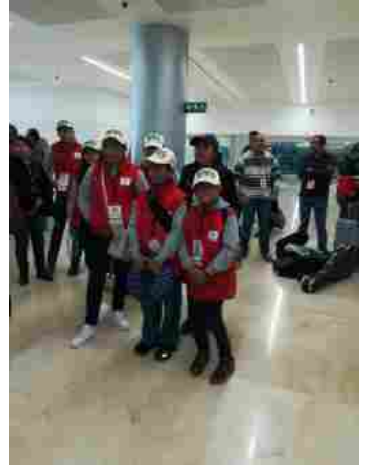
Representando las costumbres y Tradiciones del Municipio en Día de muertos.