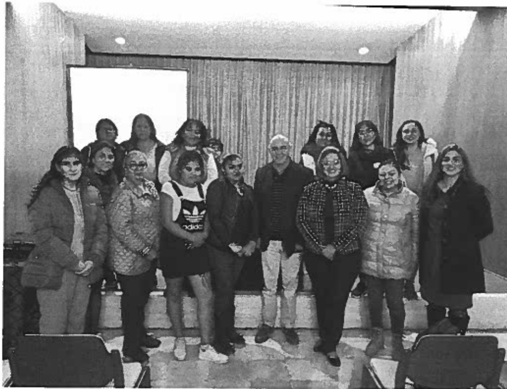
CONFERENCIA ALERTA DE GENERO, MUJERES DE AVANZADA