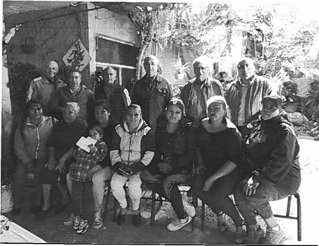
CONFORMACION DE CLIC'S