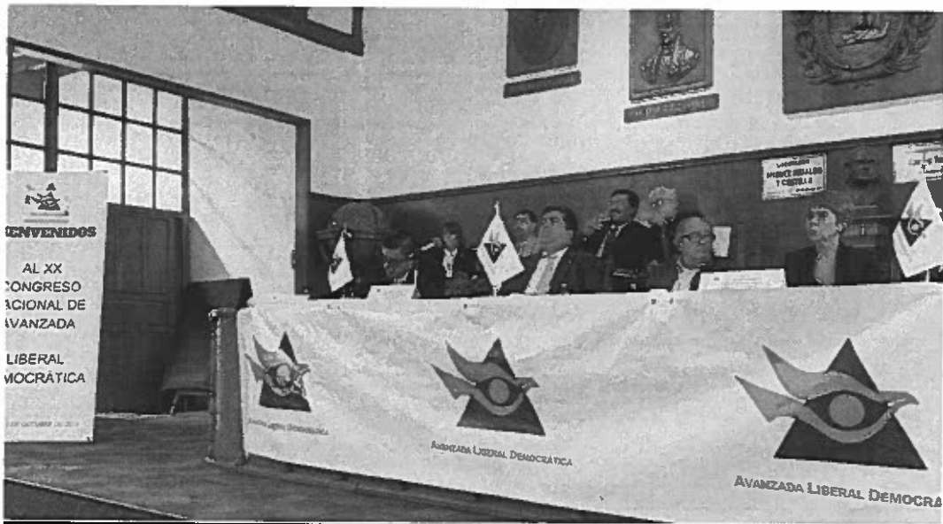
XX CONGRESO NACIONAL DE AVANZADA LIBERAL DEMOCRÁTICA