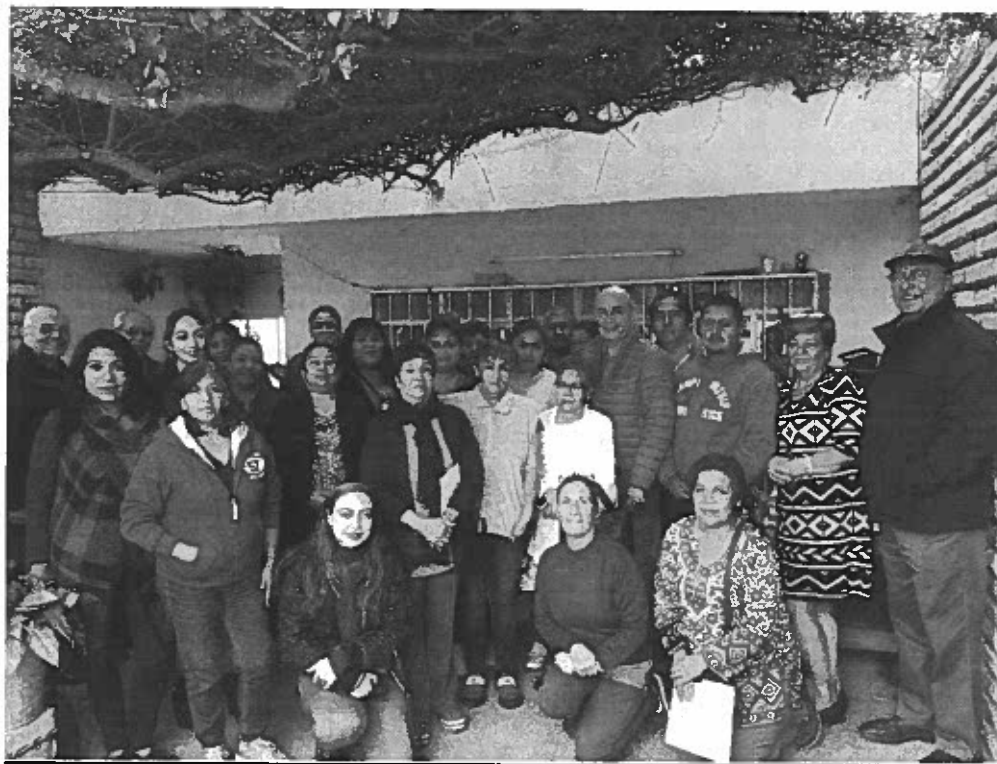
CONFORMACION DE CLIC'S