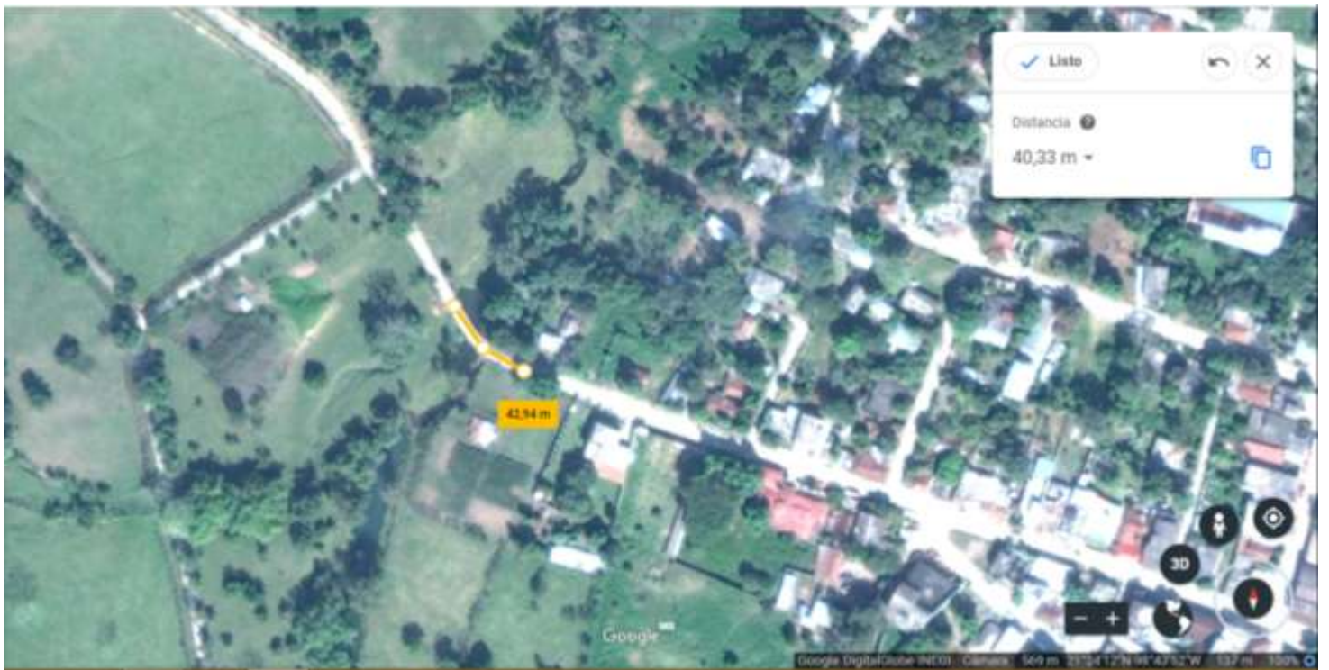
EL SEGUNDO PUENTE SE UBICA CARRETERA CHUPADERO-TAMPACAN CON LAS SIGUIENTES CORDENADAS (21°24'09"NORTE) (98°53'54" W)