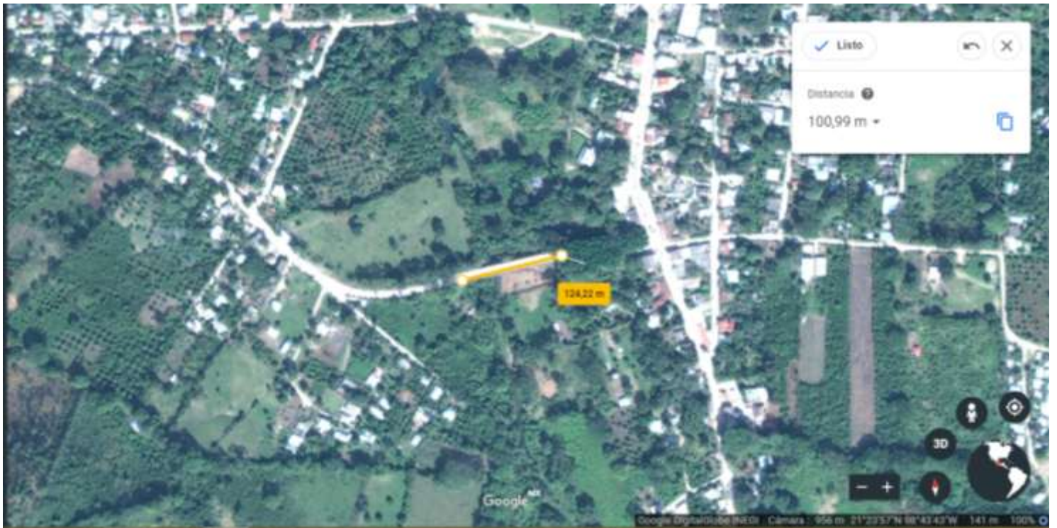
PUENTE PRINCIPAL CON UNA DISTANCIA DE 100,99 M Y CON LAS CORDENADAS (21°23'50"NORTE) (98°43'49" W)