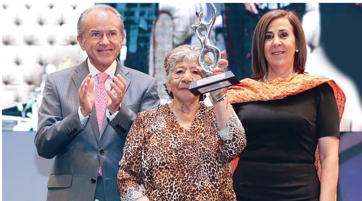
Entrega del galardón Mujer Potosina del Año 2019.