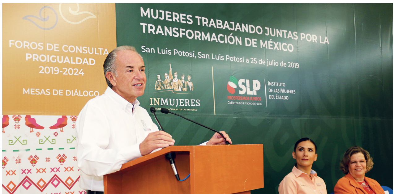
Mesas de diálogo para la Consulta PROIGUALDAD 2019-2024.

Uno de los resultados de este Programa en colaboración con el sector salud, ha sido lograr la atención médica con trato humanizado a las mujeres en situación de embarazo, parto y puerperio, y reconocer el trabajo de las mujeres y hombres que ejercen la partería tradicional.