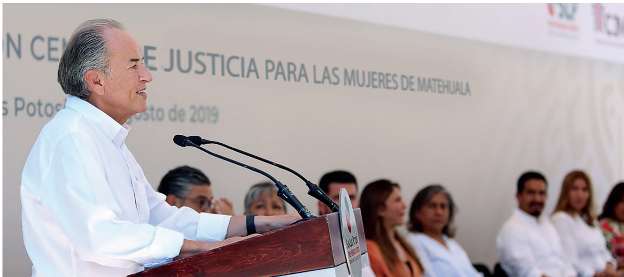
Inauguración del Centro de Justicia para las mujeres de Matehuala.

Es compromiso del Ejecutivo estatal contribuir a eliminar las barreras que impiden la participación igualitaria de las mujeres en todas las esferas de la vida, ya sea en lo público o en lo privado, al mismo tiempo que promover el progreso de San Luis Potosí, transformando la realidad principalmente para la mayoría de las mujeres y las niñas, alcanzando la igualdad de género, así como una vida libre de violencia y discriminación.