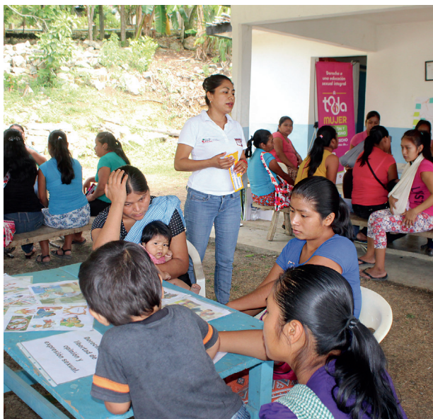
Módulo fijo de atención integral para las mujeres. Guadalcázar.

Durante estos cuatro años de la Administración, se invirtieron 96.5 mdp en programas para prevenir y atender la violencia contra las mujeres y promover relaciones igualitarias entre hombres y mujeres, registrando un incremento del 47 por ciento de 2015 a 2019.