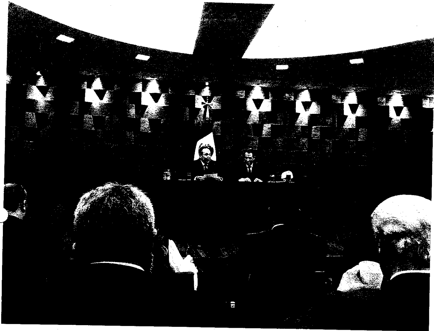
FOTOGRAFIA DE SEMINARIO EN SRE México, CDMX 11/09/2019