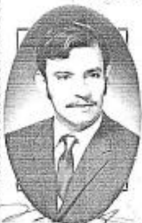
Firma del Interesado