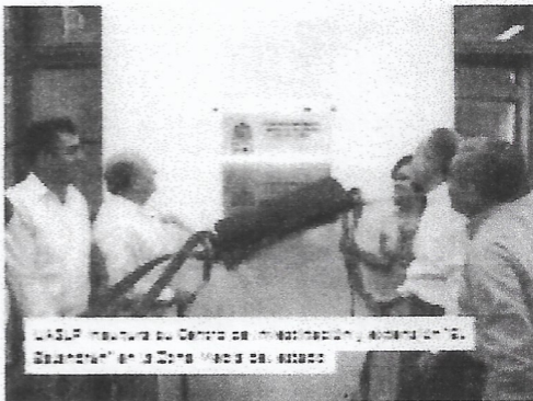
UASLP invitada al Centro de Investigación y Estudios de "El Suroeste" en la Casa Verde de México