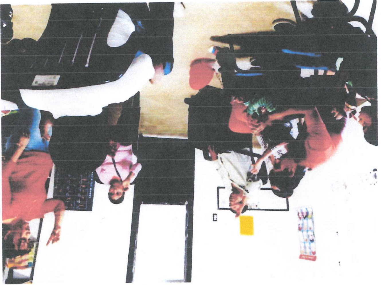
EVIDENCIAS FOTOGRAFICAS REPORTE DE LENGUA DE SEÑAS MEXICANAS MES DE MARZO 2019

SISTEMA MUNICIPAL PARA EL DESARROLLO INTEGRAL DE LA FAMILIA DEL ESTADO DE SAN LUIS POTOSI. DIRECCION DE INTEGRACION SOCIAL DE PERSONAS CON DISCAPACIDAD CENTRO DE REHABILITACION Y EDUCACION ESPECIAL