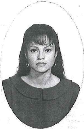
DIR. CONTROL ESCOLAR