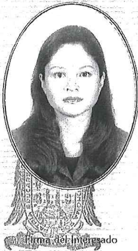
Firma del interesado